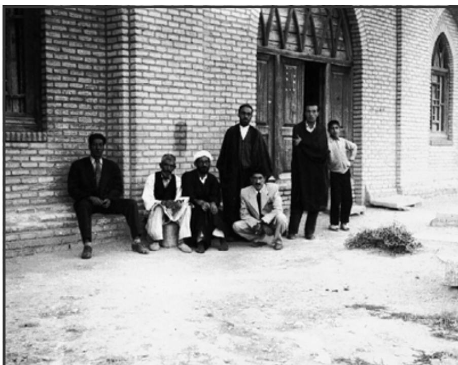
وینہی ئارامگا کۆنہ کھی بابا تاهیر له ههمه دان