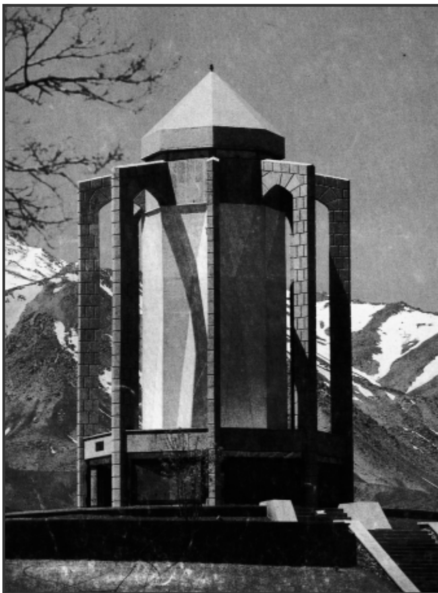
وینہی ٹارامگا تازہکھی بابا تاهیر له همهمدان