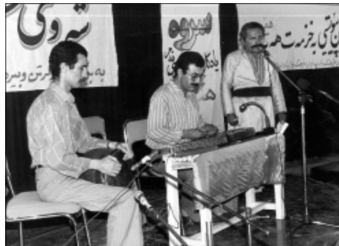
یادی هیمنی شاعیر - مه‌هاباد