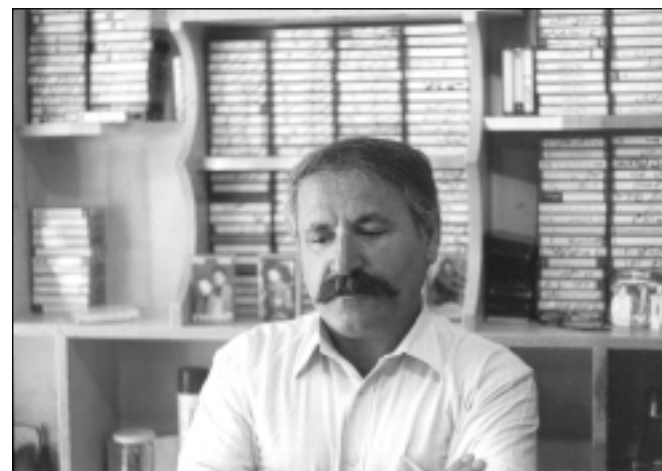
عەزیز شاروخی لە تۆمارگای شاهرۆخ مەهاباد