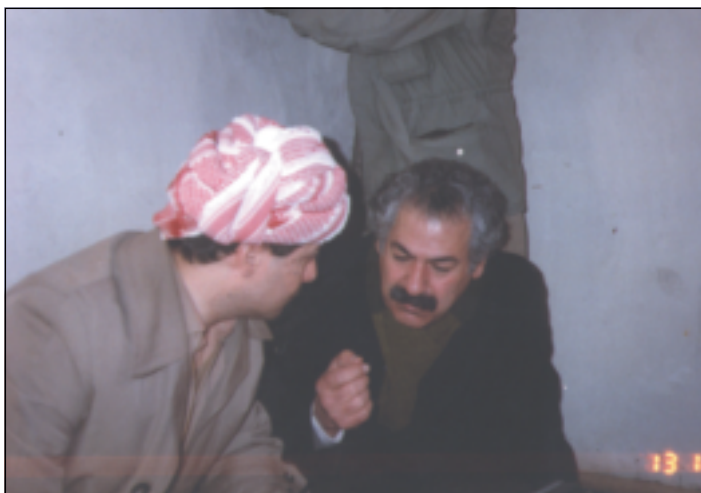
دوای به سستی کۆنگره‌ی ده‌یه‌می پارتی ١٩٨٩ سەرۆک بارزانی و فه‌له‌که‌دین کاکه‌یی