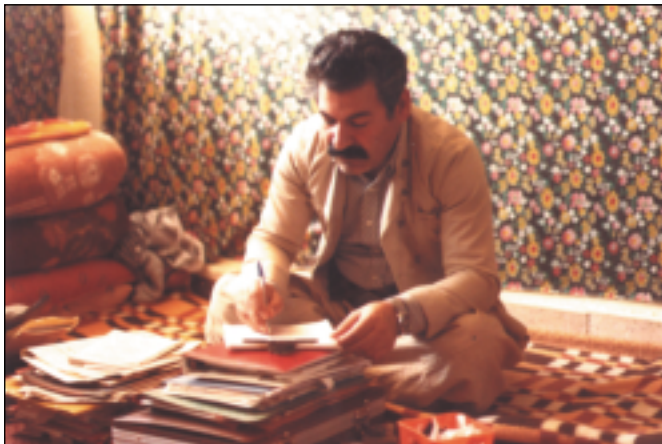
له مەكتەبی ناوه‌ندی راگەیاندن له مەكتەبی سیاسی، راژان هاوینی ۱۹۸۰