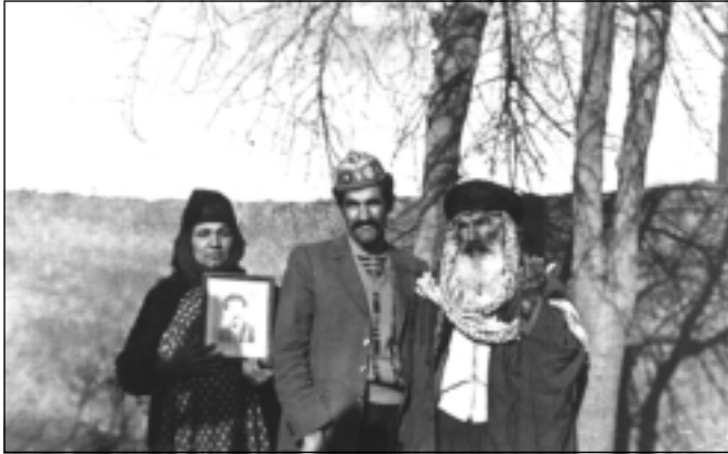
له راسته وه بۆ چهپ: باوکی فهله که دین ، برای فهله که دین، دایکی فهله که دین ... که وینه یه کی فهله که دین-ی بۆ یادگاری هه لگرتووه، سالی ۱۹۸۳.