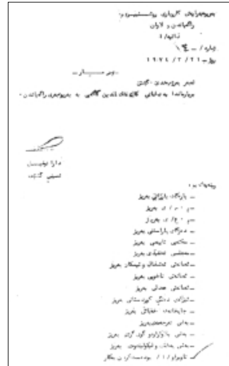
بیریاری دانانی فەلەكەدین كاكهیی به به‌رێوه‌یه‌ری راگه‌یاندن، به ئیمزای شه‌هید دارا ته‌وفیق ١٩٧٤/٣/٢١