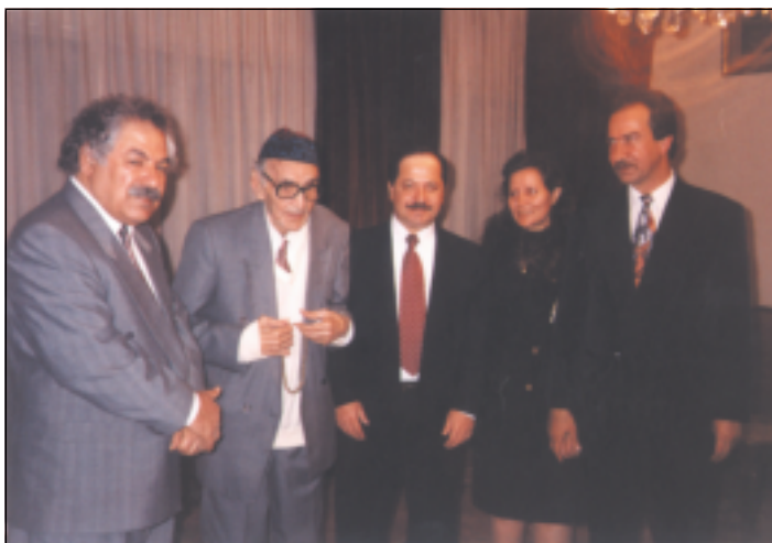
مالتی شاعیری عیتراتی ناسراو محمدهد مههدی جهواهری، دیه شق بههاری ۱۹۸۶ له راستهوه: سهباح مهندهلاوی، خه یال جهواهری، سهروک بارزانی، محمدهد مههدی جهواهری، فهلهکه دین کاکهیی