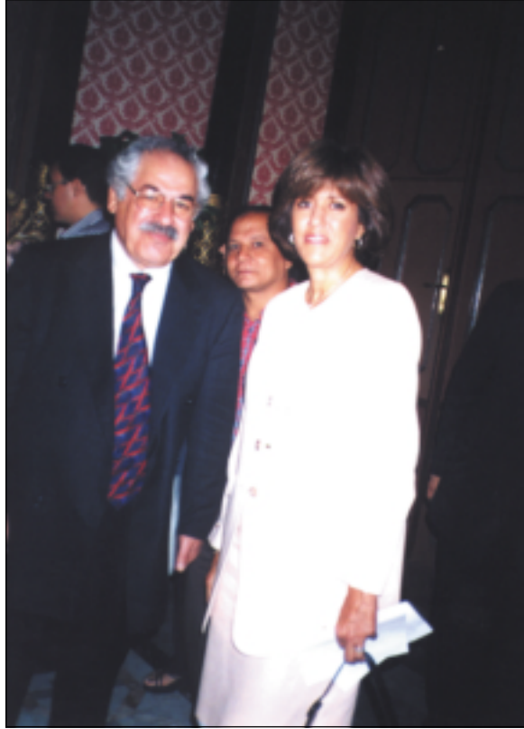
قاهيره - ميسر ۲۷/۹/۲۰۰۰ د. ه ودا جه مال عه بدولناسر كچي جه مال عه بدولناسر سهروكي عه ره بي ناسراو، فهله كه دين كاكه بي