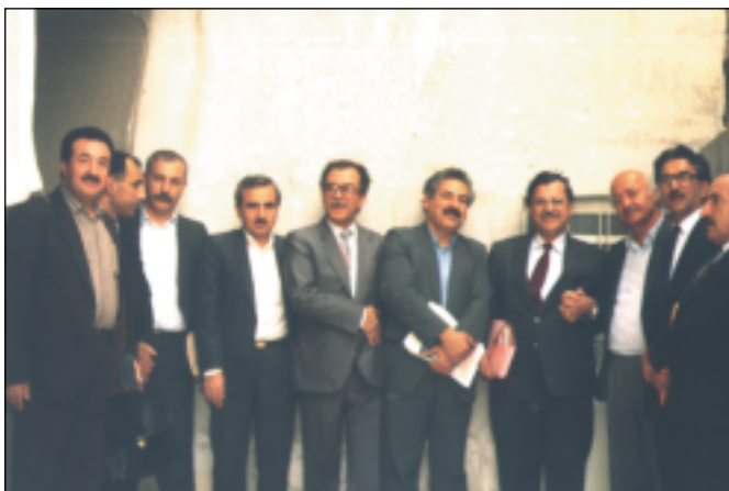
کۆیوونه‌وی سهرکردایه‌تی به‌ره‌ی کوردستانی، دیمه‌شق تشرینی دووهم ١٩٩٠ له‌راسته‌وه: د.مه‌حمود عوسمان، سامی عه‌بدوڵه‌رحمان، عه‌زیز مه‌مه‌د، جه‌لال تاله‌بانی، فه‌له‌که‌دین کاکه‌یی، فه‌خری که‌ریم، نه‌بو هه‌یوا، سه‌ید که‌ریم، عه‌دنان موفتی، د.که‌مال خۆشناو