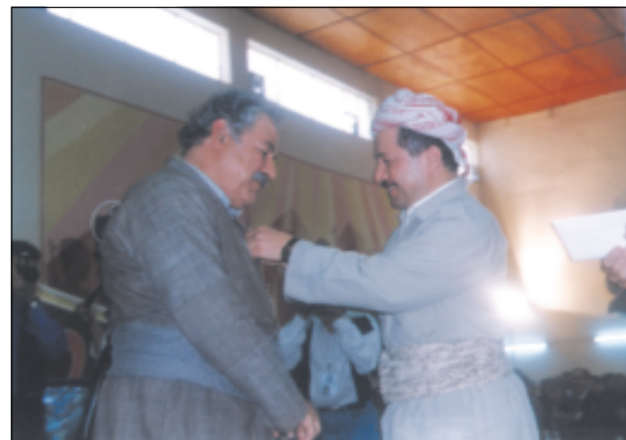
وه‌رگرتنی خه‌لاتی بارزانی سالی ١٩٩٣ هه‌ولتیر سەرۆک بارزانی مه‌دالیای بارزانی نهمر به فه‌له‌که‌دین کاکه‌یی ده‌به‌خشی