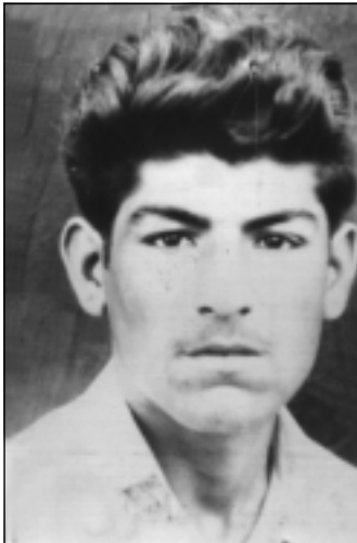
فهله که دین کاکه یی له هه رته ی لاویدا- ۱۹۶۰ ناماده یی که رکوک