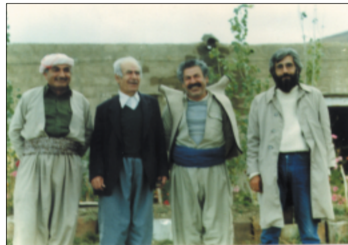
پاژان - باره گای مهکته بی سیاسی پارتی، بههاری ۱۹۸۸ له راستهوه: ده میریز (پوژنامه نویسی تورکی)، فهلهکه دین کاکهیی، مام ههژار، شه هید فرهنسو هه ریری