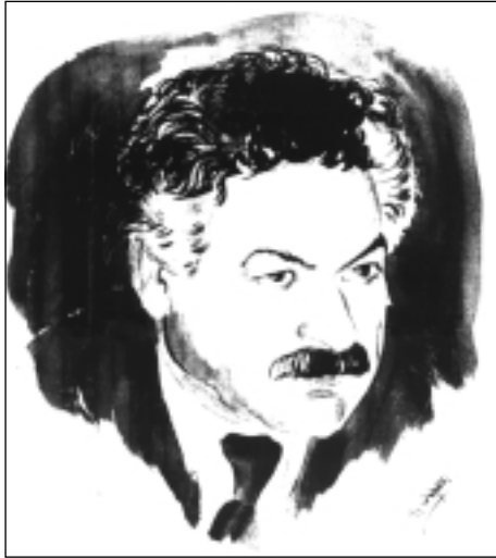
فەلەكەدین كاكهیی له وینهیهکی دەستگردا كه كچه هونهرمەندێكی سوری پیشكەشی كردوه