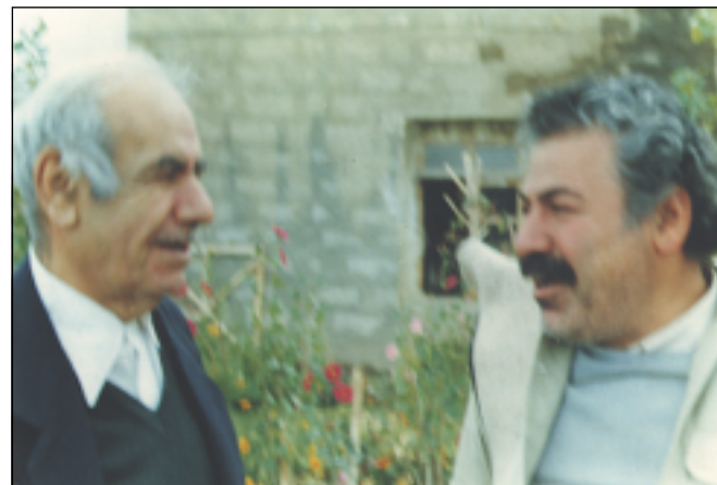
پاژان - باره گای مهکته بی سیاسی پارتی، بههاری ۱۹۸۸ فهلهکه دین کاکهیی، مام ههژار