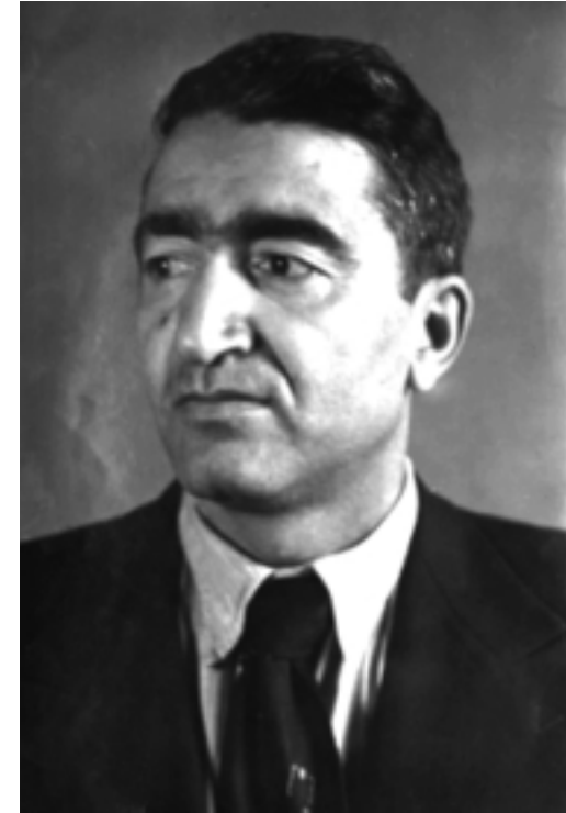
حەجیبی جندی (١٩٠٨ ک ١٩٩٠)