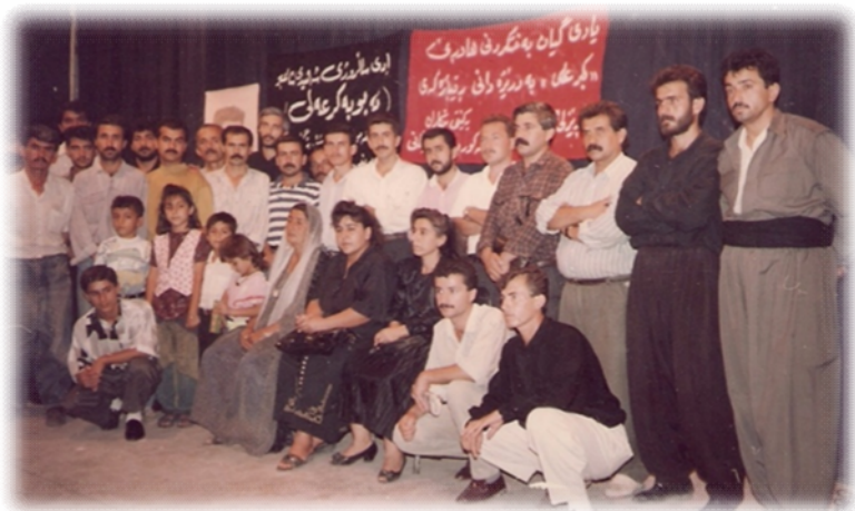
سالیادی تیروکردنی شاعیر له هۆلی روشنبیری سلیمانی 1995/9/1