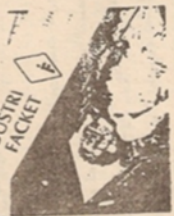
The match was lit on 1. September 1965, at the ...

بیس کردن وین مرف کردمان لاند وستان ولم جدره کتبه پرستاهه پهدا عالم گاندلیان قزلب ماران کردن له مال دهستان داندستان له فایزوه گاندلیان سه