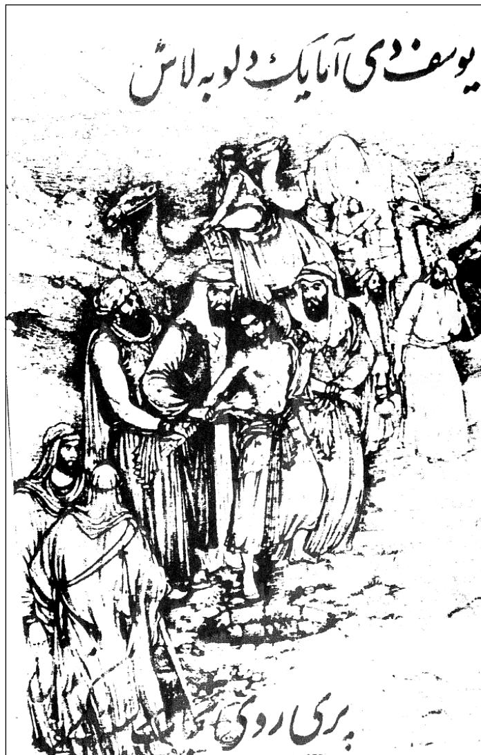
نمونه‌ی دستخه‌تی لاپه‌ره‌یه‌کی یوسف و زولبخای خانای قوبادی