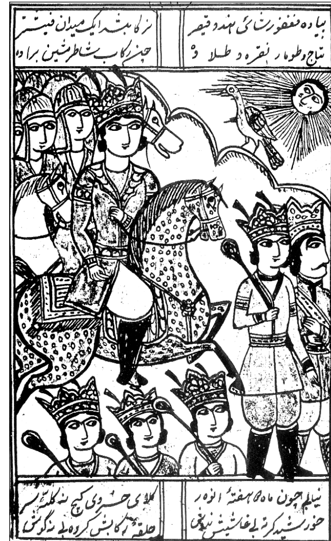
دهست خت و وینه یه کی قهله مکیشی حهیدره بهگی بهرازی