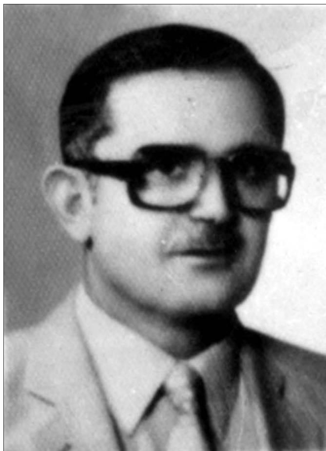
مستہفا عہسکھری دائہری ٹہم کٹیہہ