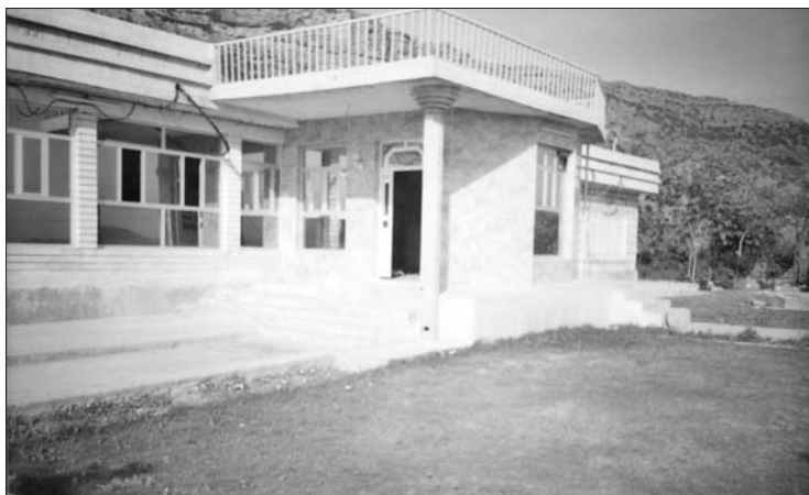
خانه‌قاي كه‌که‌ سماق