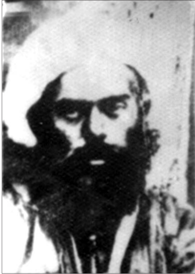
شیخ عبدالکهریمی شہدہ لہ