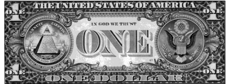
یه ک دۆلاری ئه مریکی

ئیس تاش بۆ مۆری ره سمیی نه مریکا بگه ریینه وه. نه گه ر نه مۆمهکانی نه م هه ره مه بژمیریت ده بیینی ژماره یان (۱۳) نه مۆمه، گه ر بروانیته خواره وهی هه ره مه که ده بیینی ژماره ی نه و نه مۆمانه به رۆمانی نووسراون. نه م ژماره یه هه زار و هه فته سه د و هه فته و شه شه (۱۷۷۶). گه ر ژمارهکانی نه م ژماره یه پیکه وه کۆیکه یته وه، ده بیینی ده کاته ژماره ی بیست و یه ک که نه ویش ته مه نی عاقلیه. وانیه؟ له سالی (۱۷۷۶) بوو که نه م سیازده ولایه ته سه ره خۆیی خۆیان راگه یاند. ژماره ی سیازده یه م ژماره ی گو ران و دووباره له دایک بوونه وه. له ئاخیرین شیوی مه سیحدا، دوا زده په یامبه رو یه ک مه سیح هه بوون، که نه ویش ئاماده ی مه رگ و دووباره له دایک بوونه وه بوو. ژماره ی سیازده