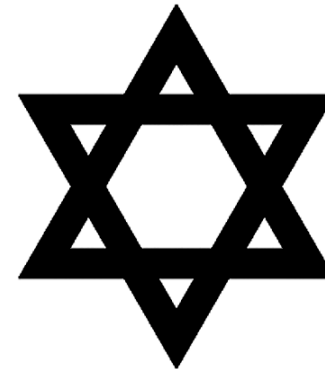
نەخشەى مۆرى سلیمان

لە سەرووى سەرى ھەلۆكەوہ نۆ ئەستىرە ھەيە كە بەشىوہى ئەستىرەى داود كىشراون.