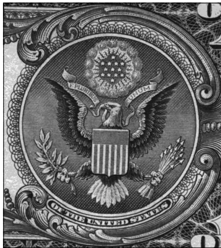
وینه ی هه لۆی سه ره مۆری ره سمی و دۆلاری ئەم ریکی

ئەو هه لۆیه دپته خواره وه و دپته نیو دنیا ی دوولایه نه دژه کان و دپته نیو بواری کرداره وه. یه کیک له رووه کانی کردار جه نگو و ئەوی تریش ئاشتییه. بۆیه له یه کیک له چنگه کانی (۱۳) تیری هه لگرتووه ئەو تیرانه سیمبولی جه نگن، له پیکه ی تریشی لقی دره ختیکی (لۆریل) هه لگرتووه که (۱۳) گه لای پتوه یه و سیمبولی بنه ره تیی گه فتوگو ی ئاشتی خوازانیه. ئەم هه لۆیه چاوی بریوه ته لقی دره خته لۆریل. ئامانج خوازه کان ئەوانه ی ولاتی ئیمه یان بونیاد نا چه زیان ده کرد ئیمه پروانینه ئەم لایه نه، واته لایه نی پتوه ندیییه دیپلوماتیه کان و ئەو شتانه ی بابته تی ئەمه ن. سوپاس بۆ خودا که تیره کانی له پیکه ی تریا هه لگرتووه، چونکه ئەگه ری ئەوه هه یه به کار نه هینرین.