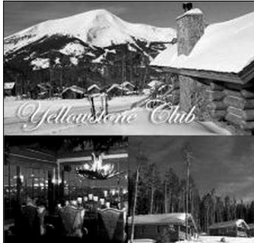
ٹارامگہ پیکہی ملیارڈیرہکان