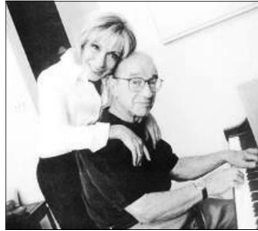
ئالان له گه ل ژنه ژورناليسته كه ي