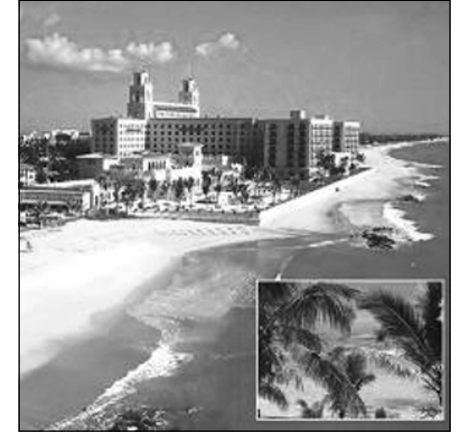
شوینی حہوانہی ملیارڈیرہکان