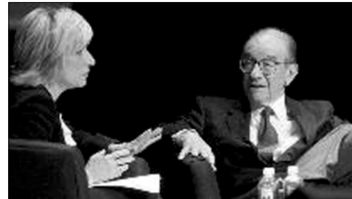
ئالان له ديمانه يه كي ته له فزيونيدا