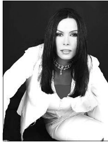
بەريۆبەرى ئامۆزگەى ستاركى