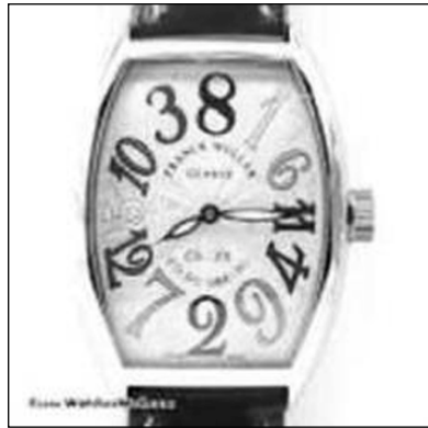
سەعاتە نامۆيە گرانەكە