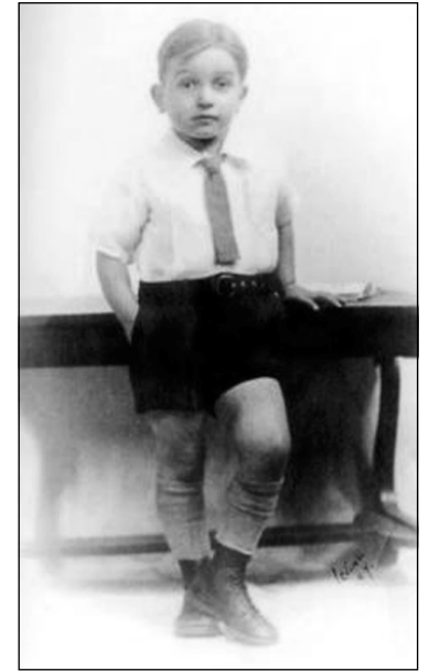
ئالان به منالئ