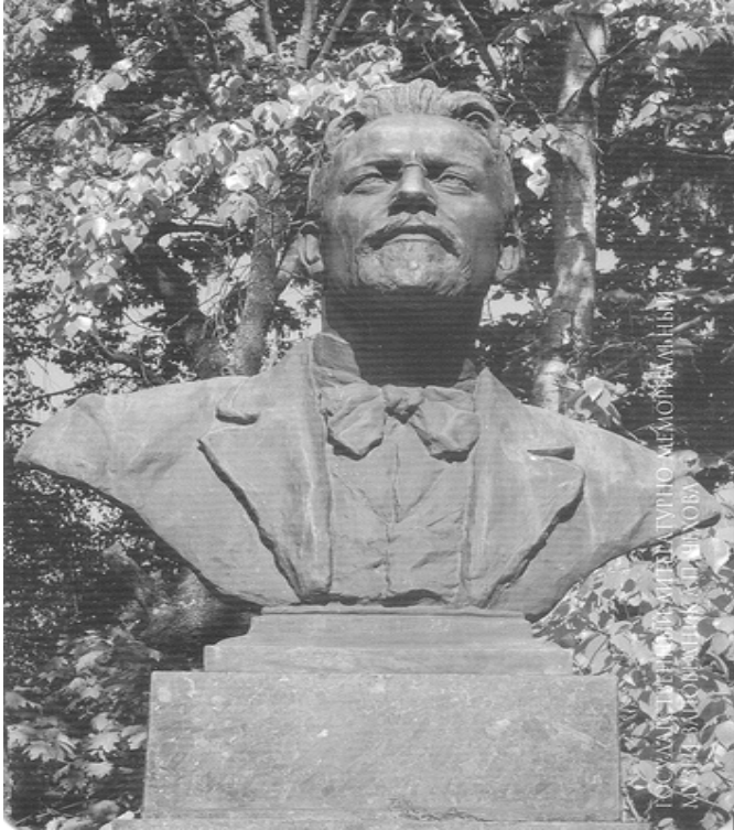
په يکەری ئەنتۆن چيخوف له مليخوفا