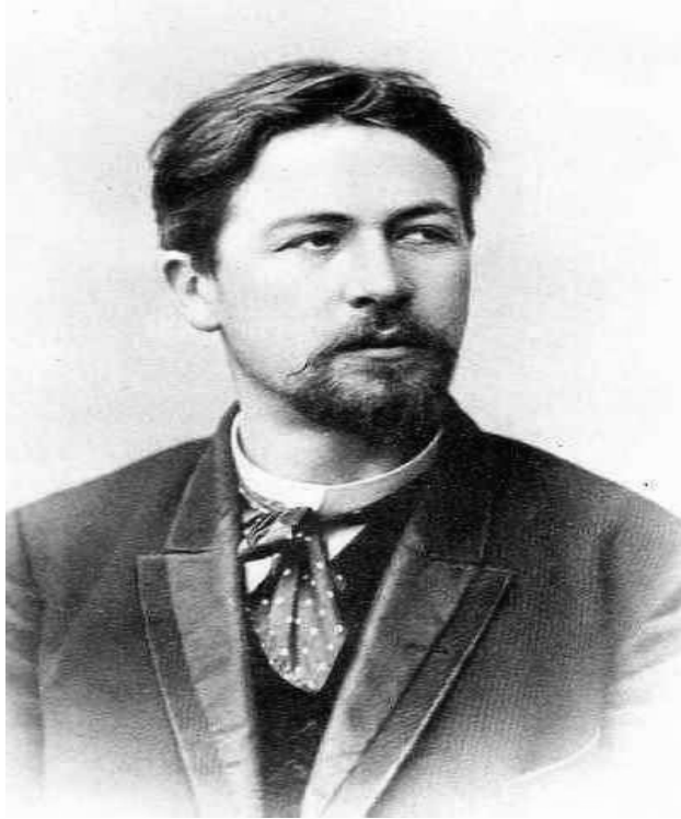
ئەنتون پافلوۋىچ چىخوف ۱۸۹۳