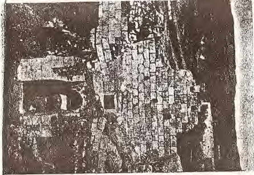
دیتهنی ناسه وهری په رستگه یه کی میهر له نیشاپوری نزدیک به کارون که لیکوله ره وه کان به په رستگه و ناور که دهی زهرده شتی ناوده بن.