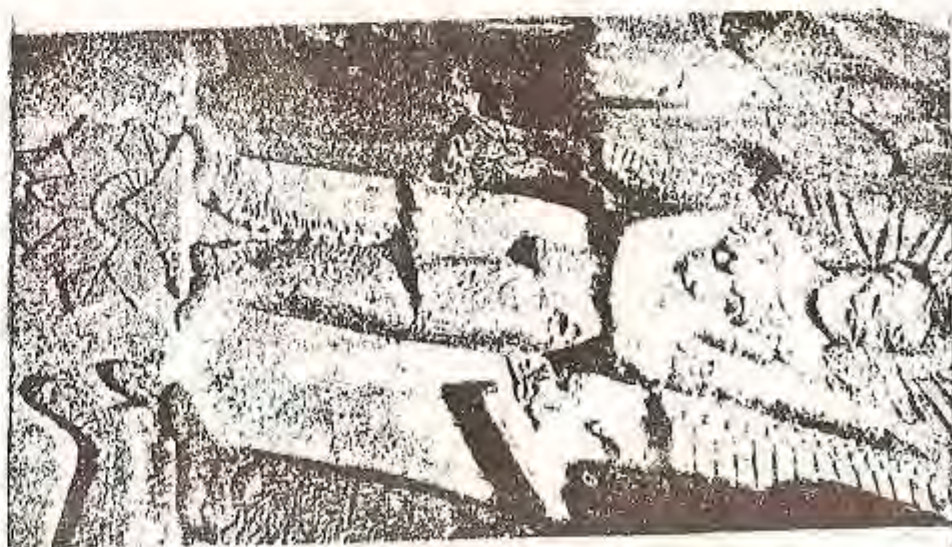
شو نیگاره دهر به ریوه له ده ختی بوستاندایه، و میسرا ده نو تیتیت، به لام ساو دیه کتاسخی لیکوله ره وه نهو په یکه ره بیان به زهرده شت و یاشاتیش به ناهورا مه زدا زانیور.