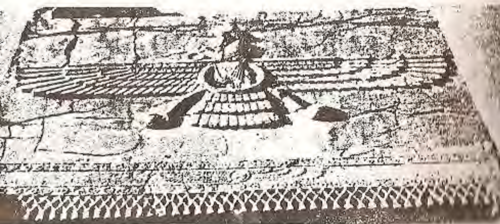
نیگاری فرقه هدر له سدر دهرکی بهردینی کوشکی جه مشید