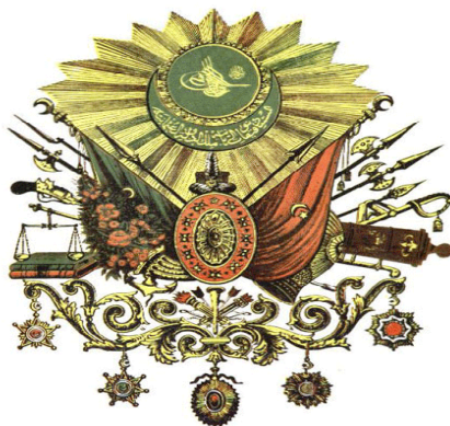
دروشم و هیمای عوسمانییه‌کان