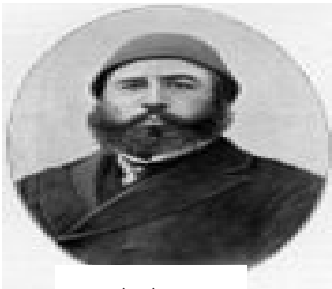
مستھ فا فازل