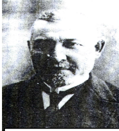
د. عېبدوڤڤا جھودھت