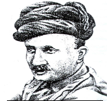
کامهران به درخان