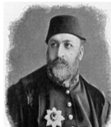
سولتان عہ بدولتجہ زیزی یہ کہم