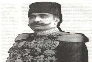
ژەنەرال شەریف پاشا

نوینەرى كورد ئەكۆنگرەى ناشتى پاریس(1919ز)