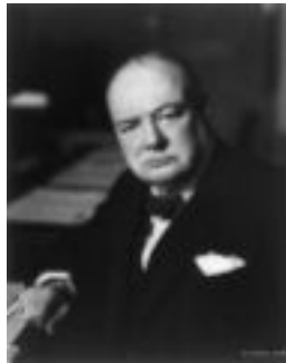
ونستون چھرچل نھ یادا شتھ کانیدا باسی رابھرائی تورانیزمی کردووه