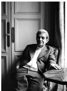
زىيا كوك نالب