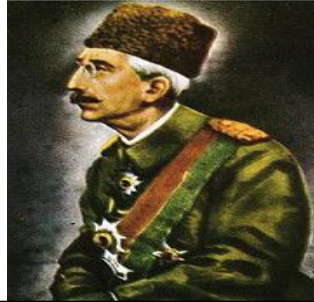
سولتان محهمه دی شه شه م سولتانی ره می عوسمانیه کان