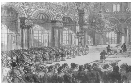
په‌رته‌مانی ده‌وٚته‌تی عوسمانی