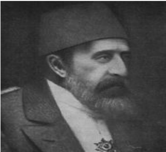
سولتان عہ بدولتجہ میدی دووہم دوژمنی سہ رسہ ختی سہر کردہ گانی توڑانیزم