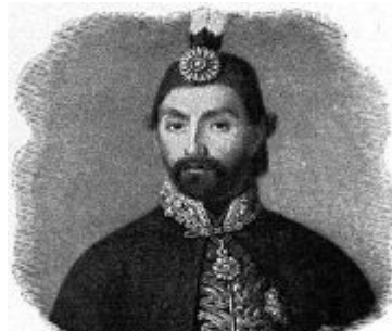
سولتان عہ بدولتجہ میدی یہ کہم جیبہ جیکہری ریفورم نہ سہر روتی خوڑناوایی