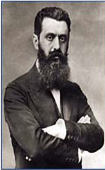
تییودور هرتزل دامه زینھری زایونیزم