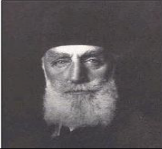
سولتان عه بدولته جیدی دووهم دوایین سولتانی بنه مائهی عوسمانی