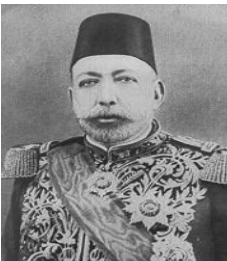
سولتان محہ مہدی پینچہم سولتانی گویرایہ لی نیتیجادیہ کان