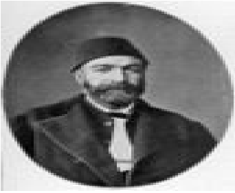
عہ بدولتجہ مید زیا پاشا