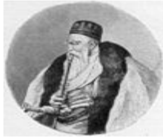
عہ لی پاشا