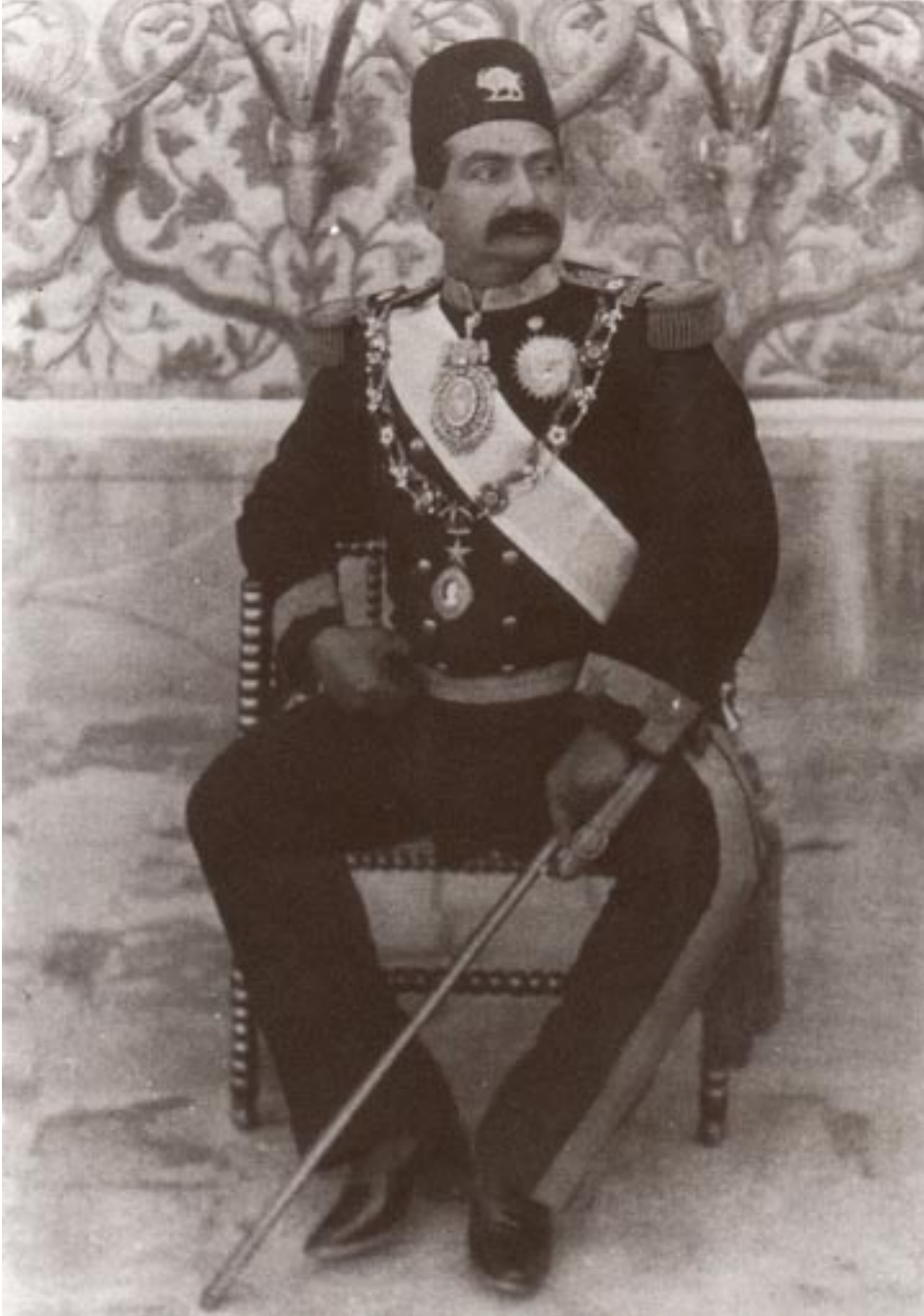
مسعود شاه (ظل السلطان)