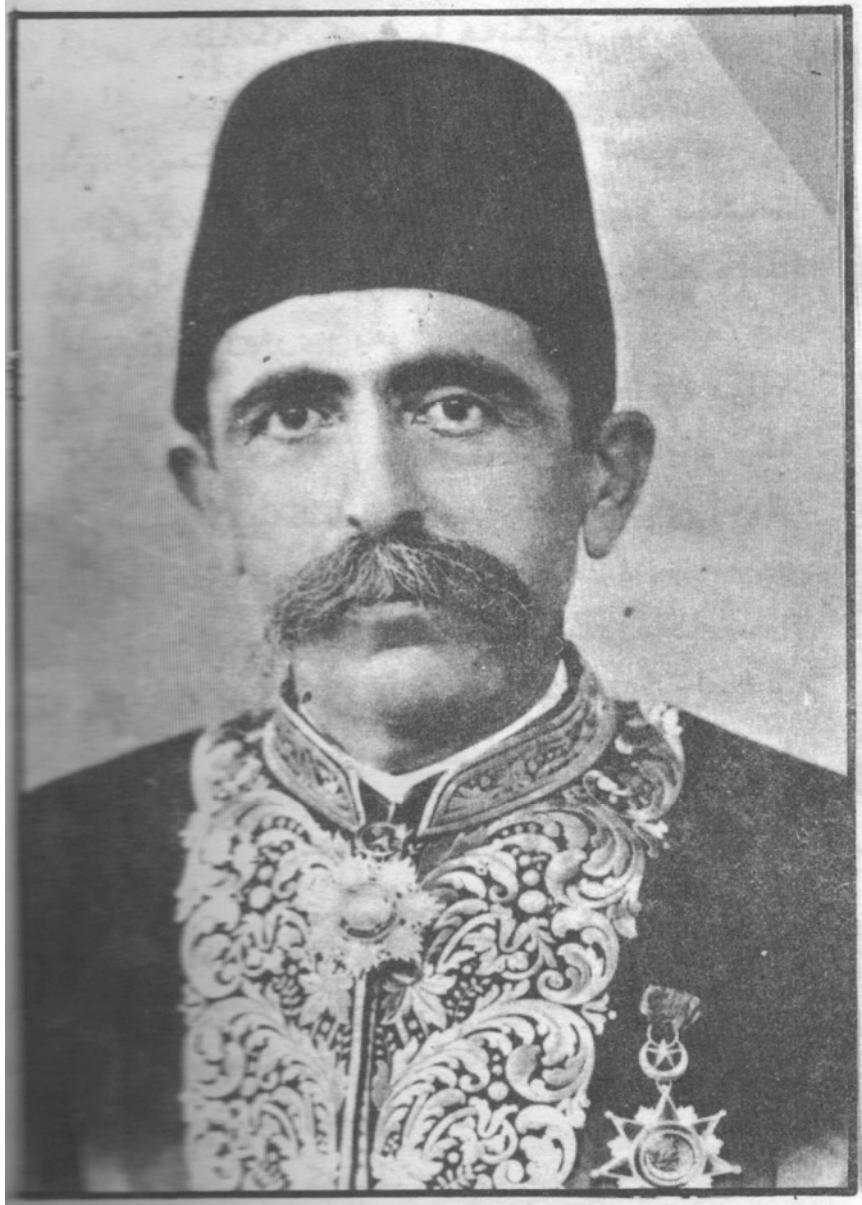
مهموود پاشای جاف