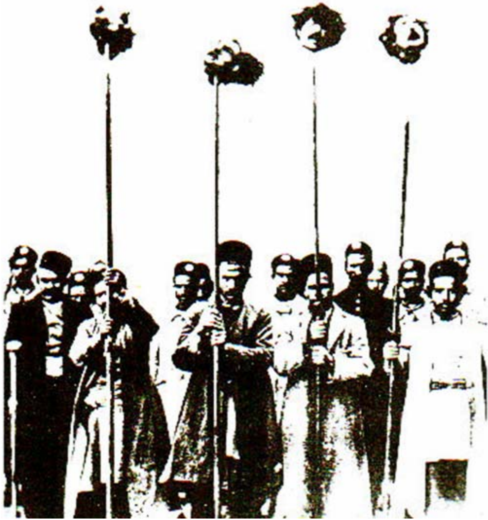
سہری جو امیرناغا و ہاوپرکائی