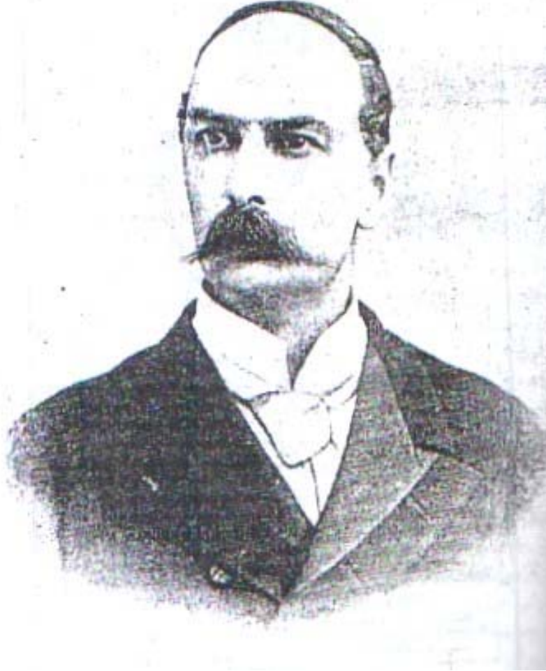
بارۆن ئىدوارد نۆلد ۱۸۴۹ز - ۱۸۹۵ز