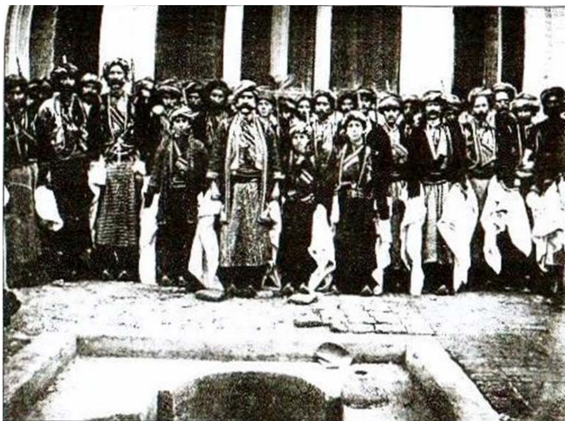
جوامیرئاغا و سواره‌کانی