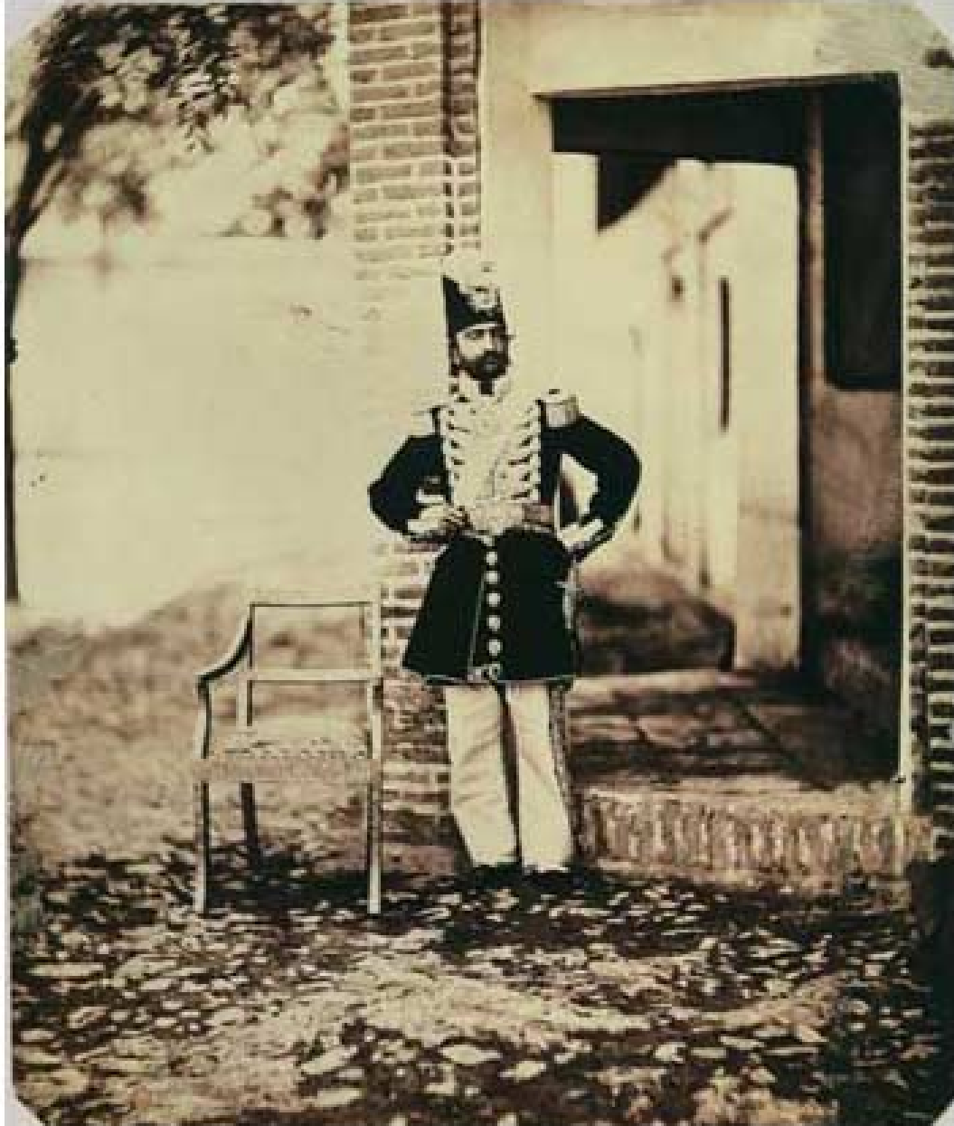
(ناسره ددين شاه) ي قاجار