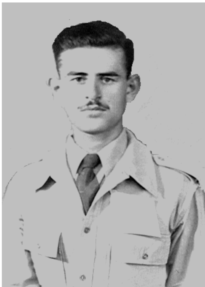
قوبوس، قادر شۆرش به بهرگی سهربازی ئینگلیزی