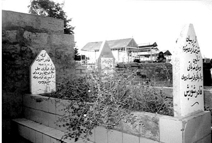
گۆری قادر شۆرش له شاری ههولیر له گۆرستانی تیمام محهمه د.