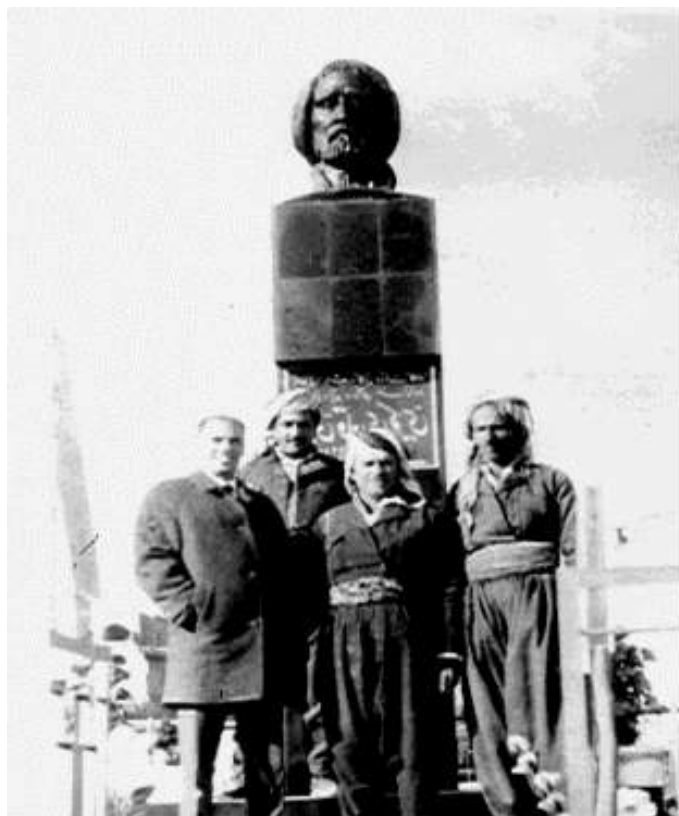
سالی 1972, کۆیه, به بۆنه‌ی په‌رده‌هه‌لدانه‌وه له‌سه‌ر په‌یکه‌ری شاعیری کورد حاجی قادر. قادر شۆرش له‌ناوه‌پاستدا.