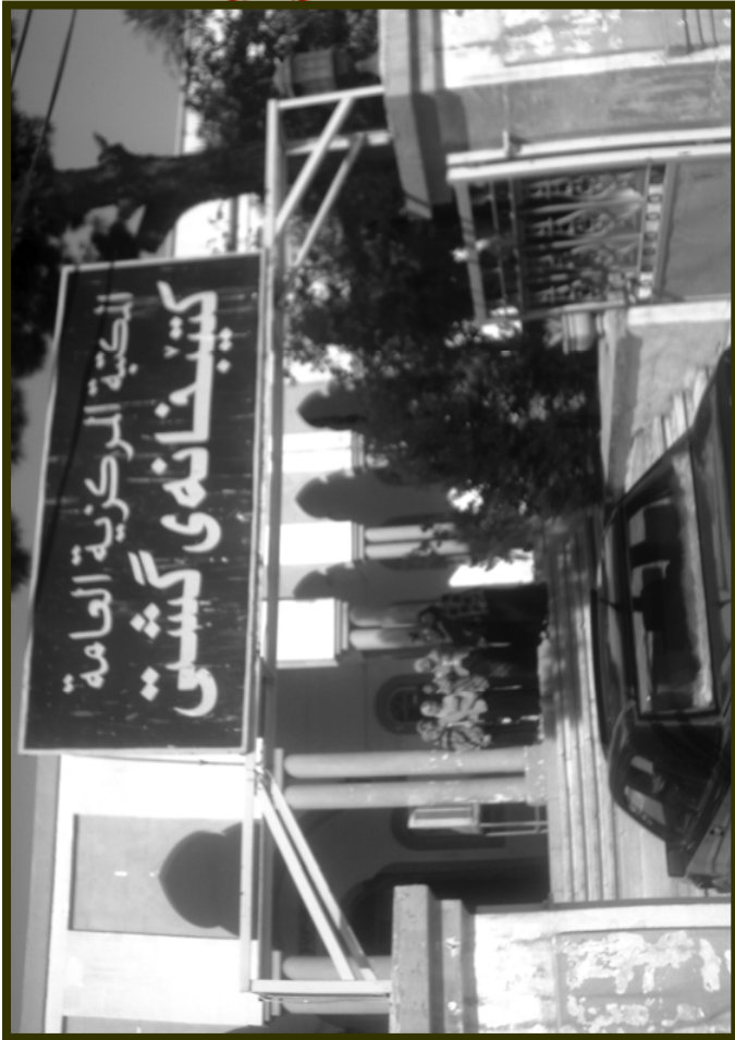
كتبخانهى كشتى كهركوك