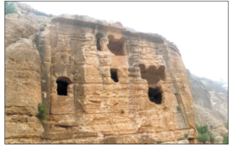
نموذج من لوحة سنحاريب ويظهر في الصورة نهوسك ذات الارقام (١٠)، ١١، ١٢، ١٣) وتوجد فوقه صورة أسدين تعبر عن قوة وحراسة الموقع