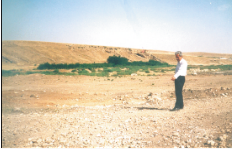
صورة في موقع (يرجوكا) تبين ترسبات المصطب النهري. اضافة الى ترسبات نهريّة فوق كهف يحيا التي تظهر في الجهة الشرقية من نهر الكومل