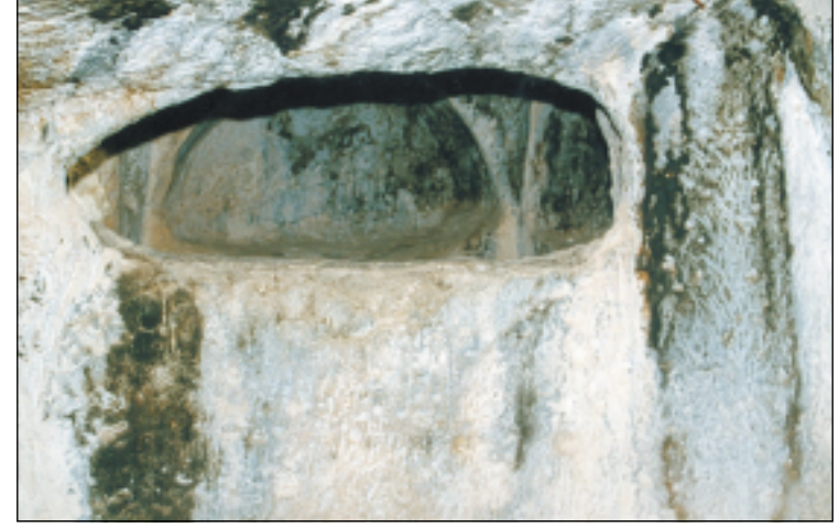
غرفتان في نهوسك رقم (٤) مرتببتان بفتحة مستطيلة الشكل