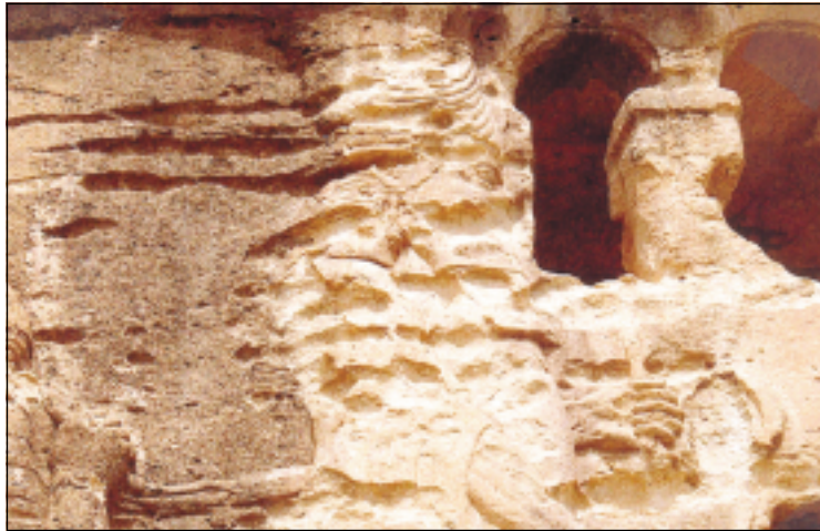
نماذج من الاشكال المحفورة على لوحة سنحاريب