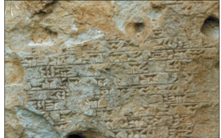
نموذج من الخط المسماري الموجود في احدى الابواب المقوسة