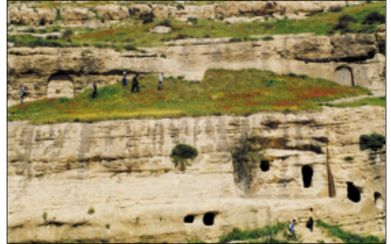
قطع صخرية يظهر فيها أهم المواقع الأثرية (نهوسكا - الحصان) رقم (٤)