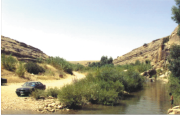
نموذج من الكتل الصخرية (الثور المجنح) التي وقعت في النهر