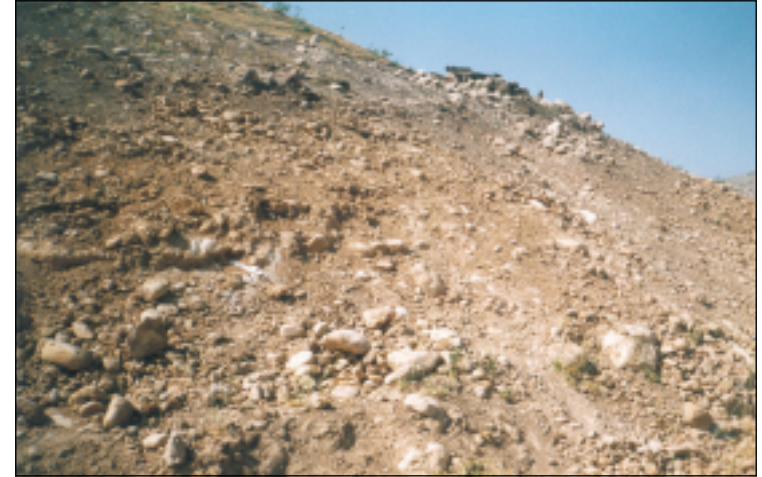
ترسبات نهريّة تظهر تحت موقع (سهريّ ديرى) وتظهر فيها بوضوح الترسبات النهريّة