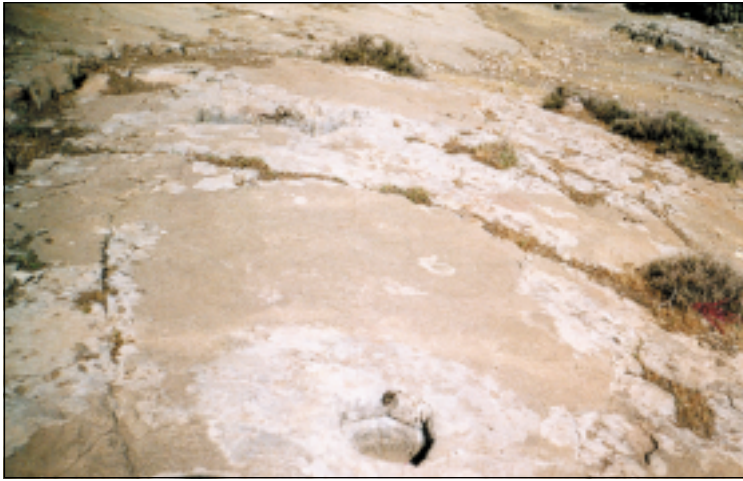
الحفرة الدائرية على القبة المستديرة خلف كانيا تابركن