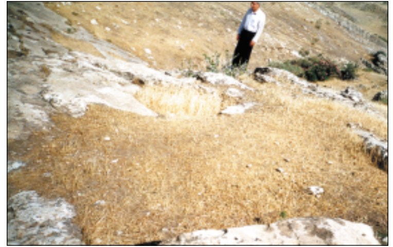
نموذج من الحفر الدائرية والمربعة في موقع پشتا كانيي.