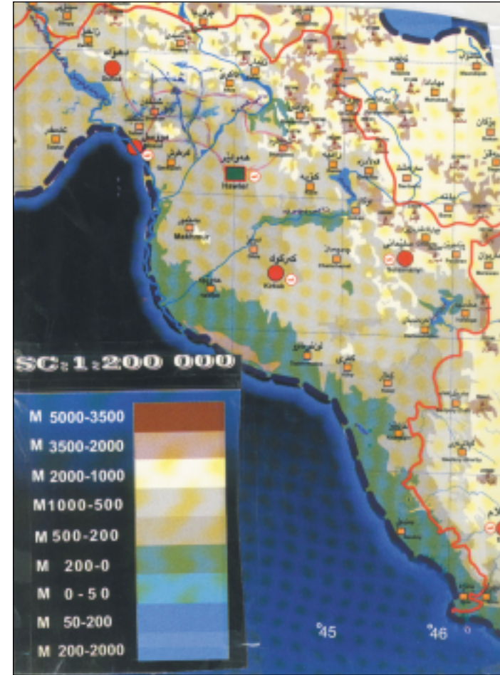
موقع خنس على خارطة كردستان في العراق