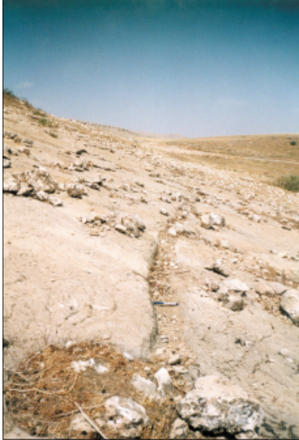
نموذج من حفر القناة في موقع پشتا رزي لنقل المياه الى موقع (سهري بهراشكي) المطل على الجهة الغربية لنهر الكومل