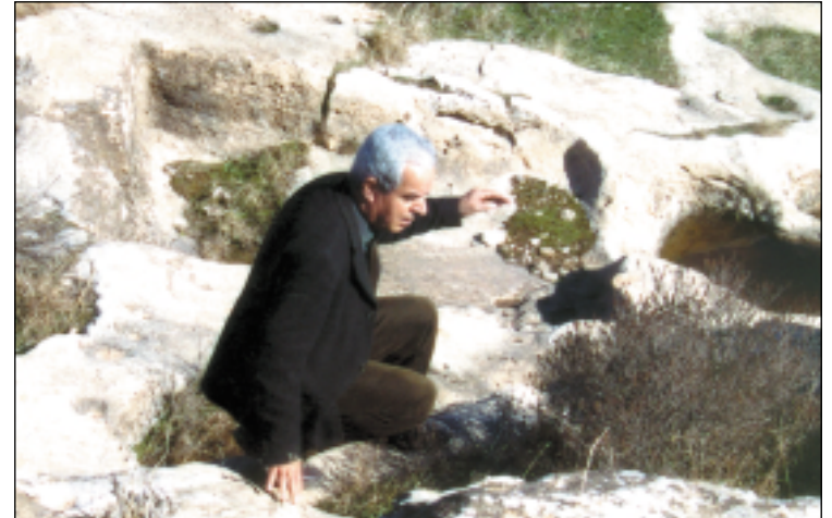
الحفر الدائرية والمربعة في موقع پشتا كانيا خنس