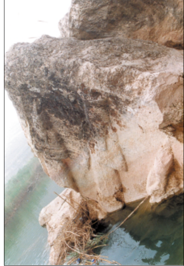
الكتلة الصخرية التي سقطت من الاعلى في موقع كهرا حيثشتری ويوجد فوقه الثور المجنح