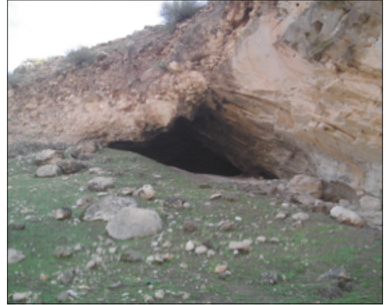
موقع كهف يحيى مبيناً المصطب النهري والترسبات النهريّة