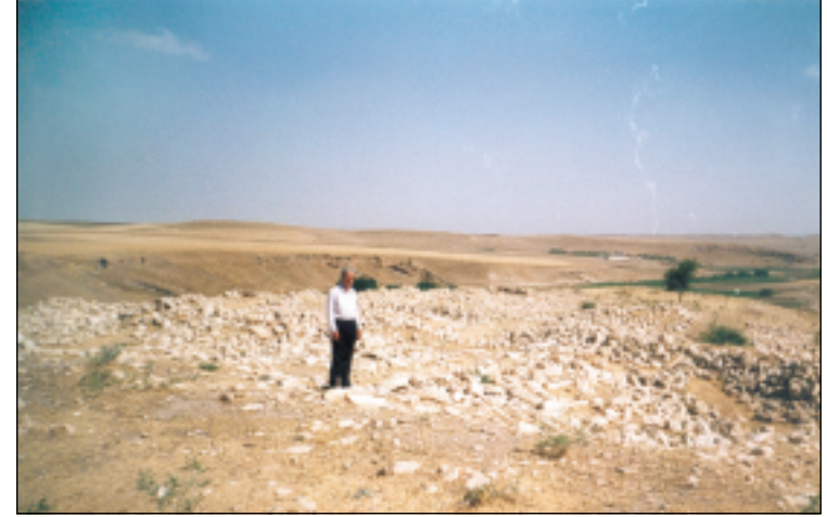
موقع قرية خنس الذي سوّي مع الارض في عام ١٩٨٨ من قبل النظام البائد