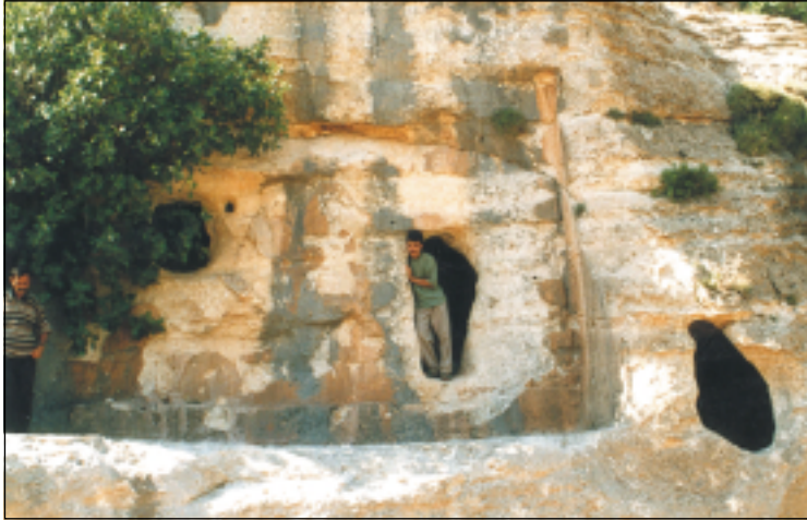
صورة لموقع نهوسك رقم (٤) الحصان - الفرس، ويظهر فيها موقع القصف الذي تعرض لها في الستينيات من القرن الماضي من قبل الطائرات العراقية