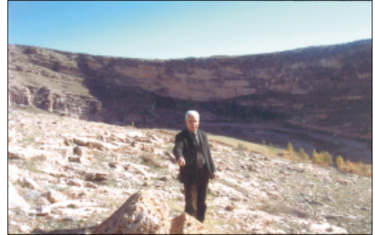
نموذج من القنوات المائية المحفورة في الصخور