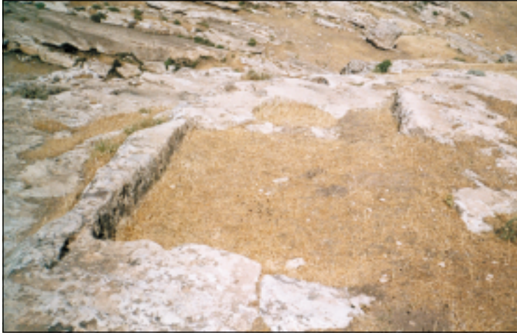
مواقع المصانع البدائية في موقع پشتا كانيين. لاحظ الحفر المربعة والحفرة الدائرية المرتبطة مع بعضها البعض