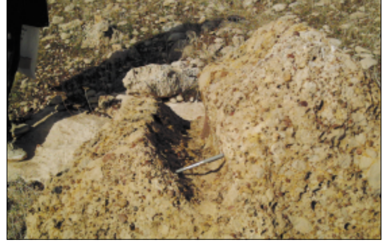
نموذج من القناة التي حفرت في كتلة صخرية صلدة