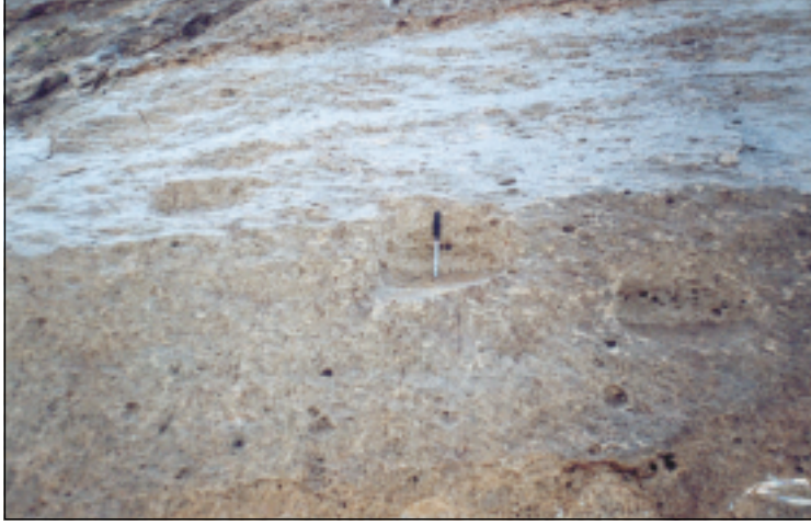
نموذج من آثار مواقع القدم للصعود الى مدخل قناة بافيان