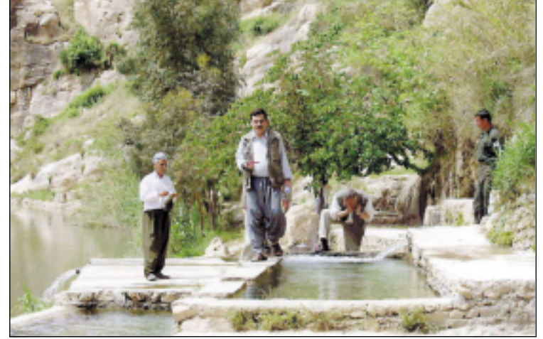
نموذج من الاحواض المائية التي انشئت بعد الاهتمام بالموقع الاثري في كلي خنس