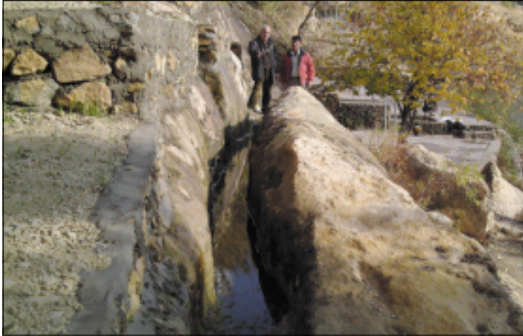
نموذج من القنوتات المائية التي حفرها لنقل الماء الى موقع لوحة سنحاريب