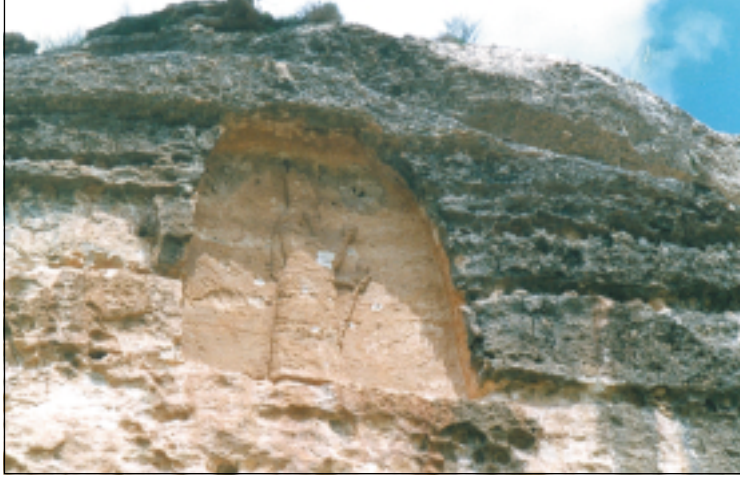
نموذج من احدى الابواب المقوسة مبيناً عليه صورة حرس يحمل سلاحاً