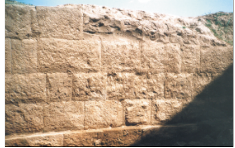
مقطع من جدار القناة التي اكتشفها بعثة حكومة اقليم كردستان في عام ١٩٩٦. الجدار مكون من خمسة طبقات صخرية