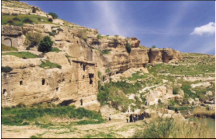
موقع ههوشن كافر