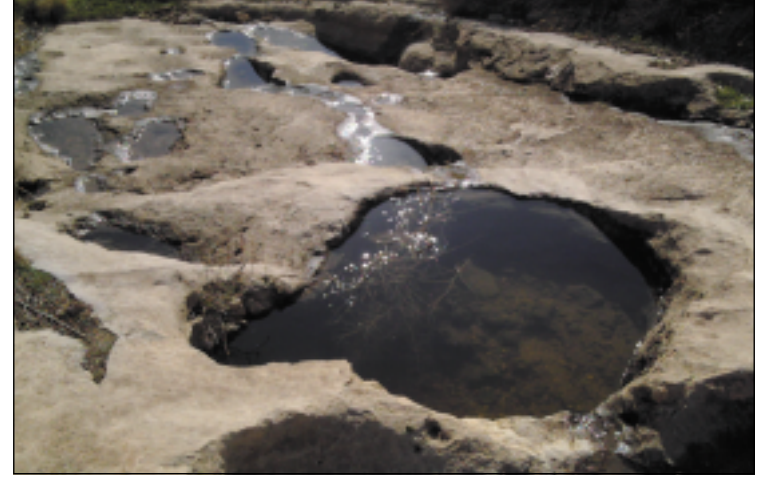
نموذج من الحفر الدائرية في موقع پشتا كانيا خنس