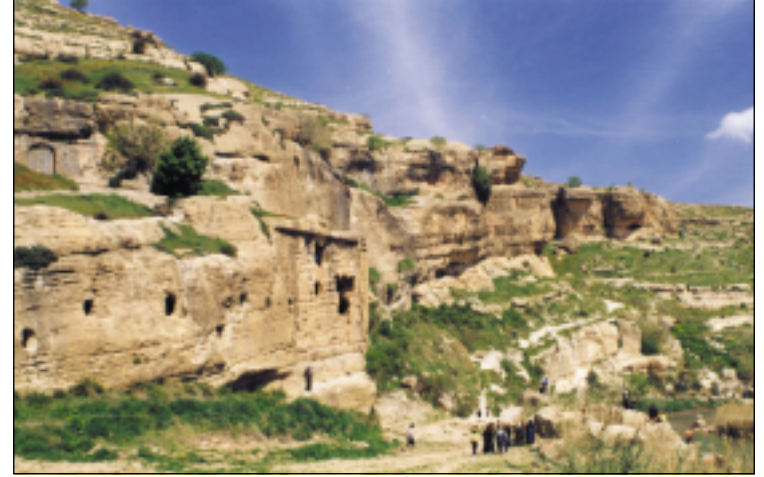
الموقع الاثري في كلي خنس