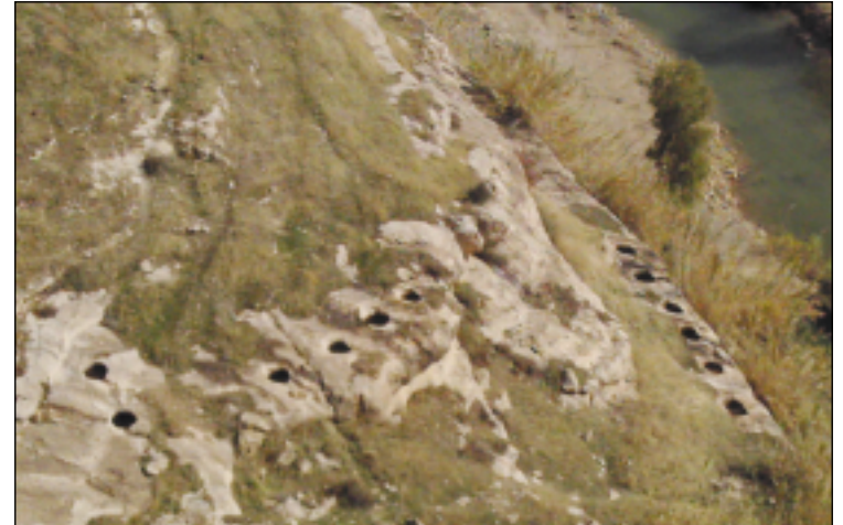
نماذج الحفر الدائرية في الصخور التي تقع اسفل كهوشى كافري