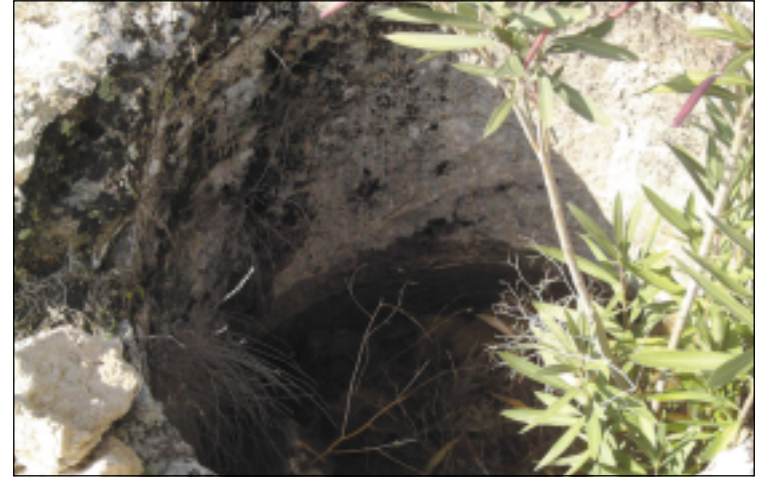
الحفر الدائرية العميقة في موقع پشتا كانيا خنس