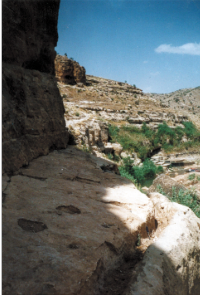
قناة مائية حُفرت في كتلة صخرية