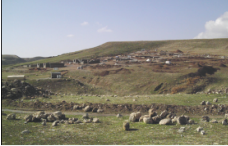
مواقع قرية خنس القديمة والحديثة