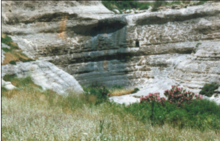
موقع نهوسكا رقم (٢) مبيناً موقع دوران المياه نهر الكوخل في الماضي خلال تاريخ تطورة