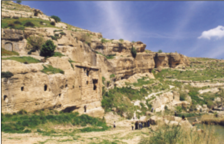
نموذج في اعمال الصخور في موقع پشتا كانيي