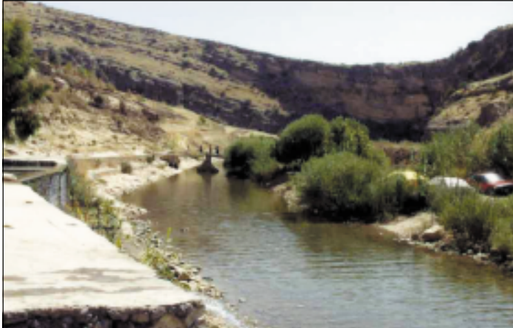
موقع بين نهوسك رقم (١٥) و كه فرئ سيتلى، القناة المائية