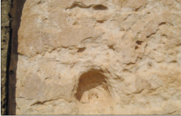
الباب المقوس المنقوش بالخط المسماري