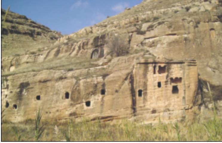
نموذج من لوحة سنحاريب