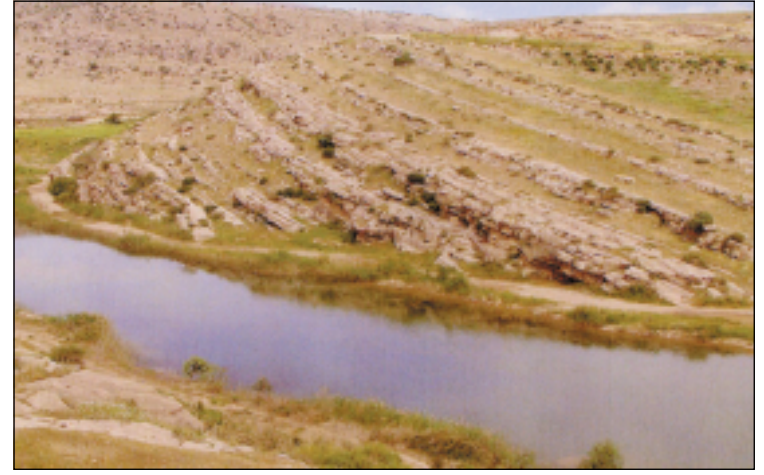
الضفة الشرقية لنهر الكومل مقابل نفق قناة بافيان