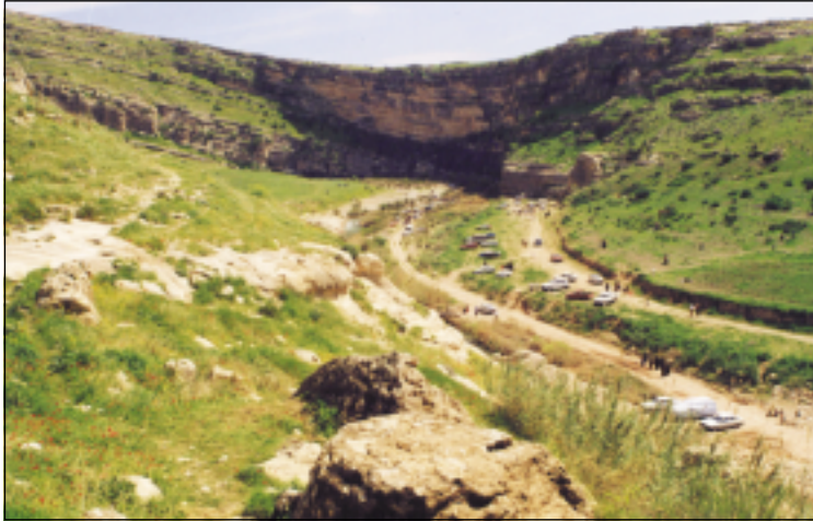
موقع كبرى كهلا، القناة المائية. نهوسكا رقم (١٥)