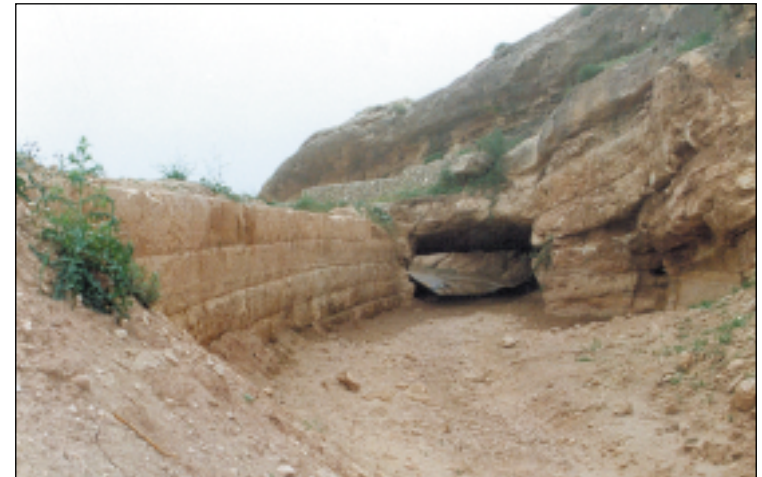
النفق الذي يربط قناة بافيان