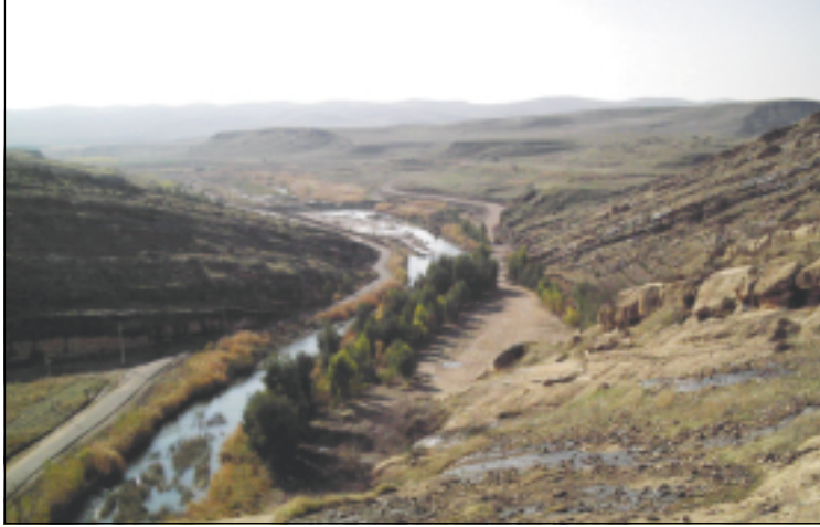
مقطع من قناة بافيان