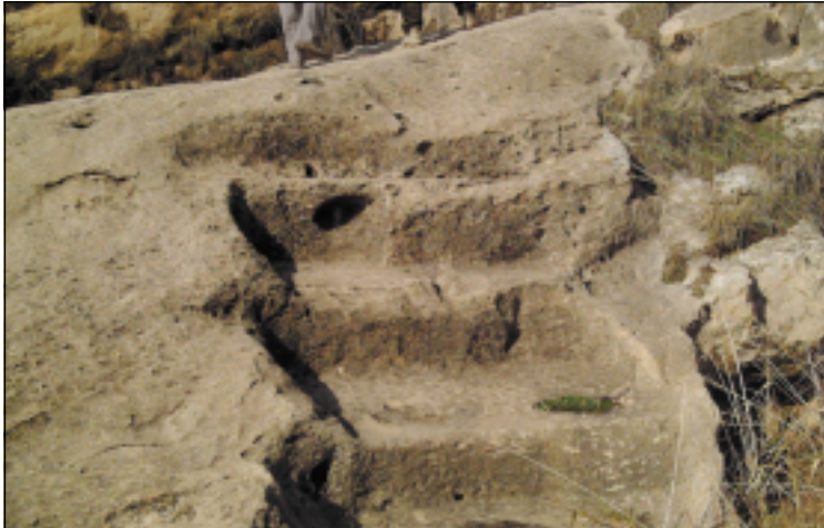
صورة للمدرج الذي يصل الى سقف قناة بافيان والى موقع نهوسكا رقم (١)