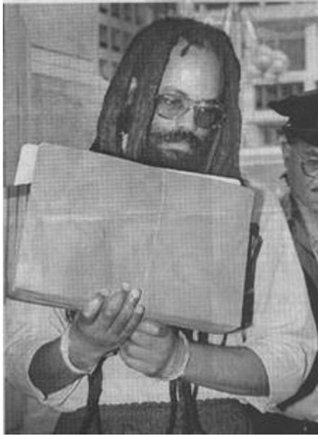
مومیا ئه‌بو جه‌مال