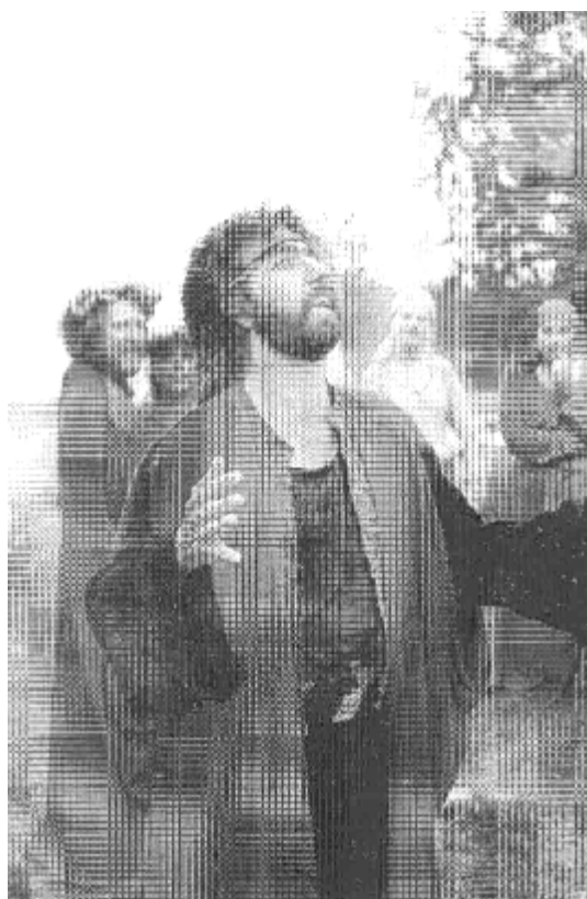
دىمەنىك ئەشانۇنامەى (كارلىيۇكس رىونە ) ستۇكھۇئىم 1995