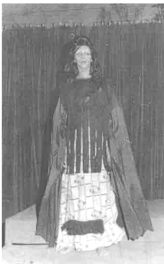
دېمەنىك ئەشانۇنامەى (راشامۇن) سائى 1979