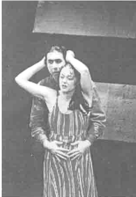
دېمە نېك ئەشانۇنامەى (گۈلى بېابان) سائى 1999