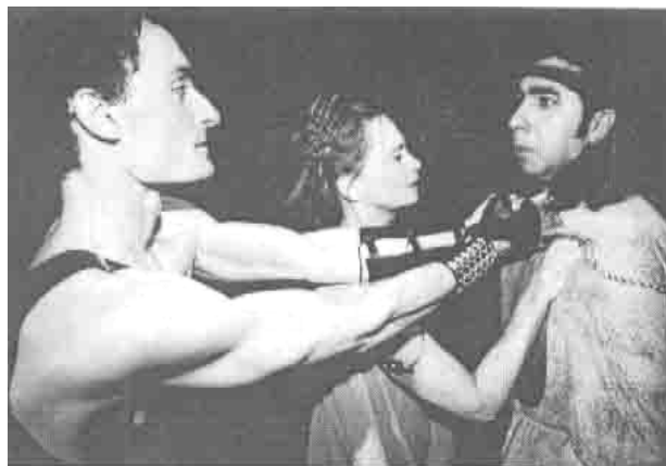
دېمە نېك ئەشانۇنامەى (گلادىاتور) سانى 1999