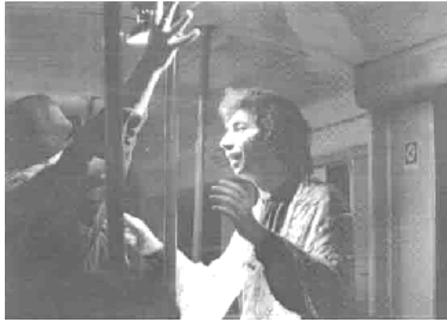
دېمەنىك ئەشانۇنامەى (بەرەو دېمەشق) نواندن و رېژى دانا رەئووف، سالى 1997