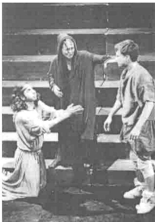
دېمە ئېك لە شانۇنامەى (گلادياتور) سالى 1999