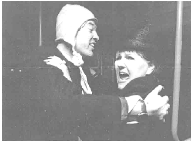
دېمەنىك ئە (بەرەو دېمەشق) ئەرىژى دانا رەئووف سائى 1997