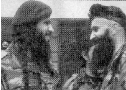
موسلمانانی ئەمەڕۆ چیتر ئەو موسلمانە لاوازو دهسته وهستانه ی چاران نییه

مه بهستی ده سه لاتداران چه ک کردنی نه یارانه، مه بهستی زله یزه کانیش چه ک کردنی هه ردوو به هه یزه کانی تر و به یه یزه کانه. نه گهر