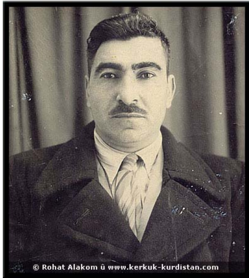
«ئەف وینە سالان ۱۹۵۲ ل سۆفیهتا بهرئ هاتیه گرتن.