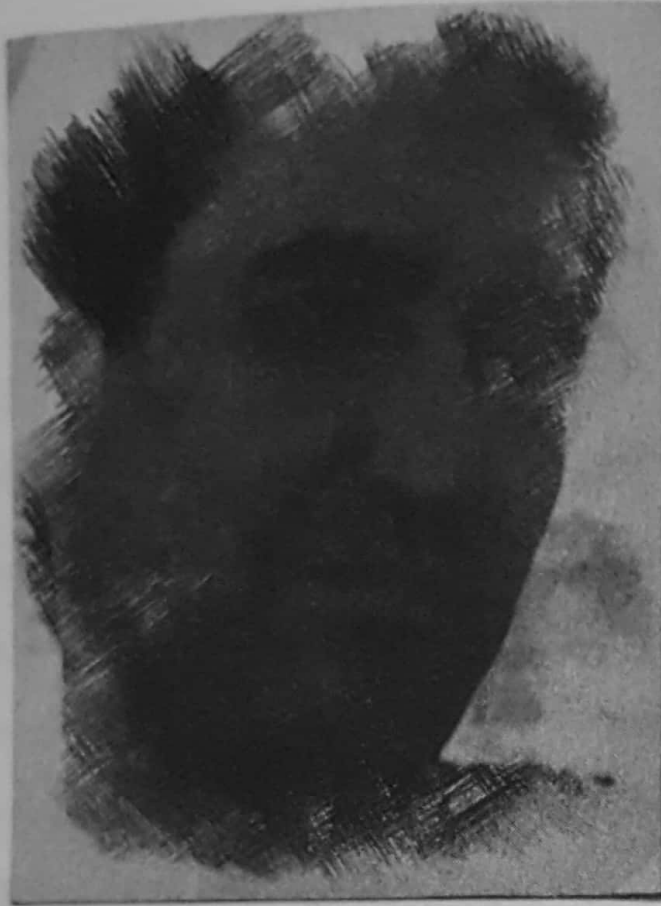
نووسه رو روناكبير: