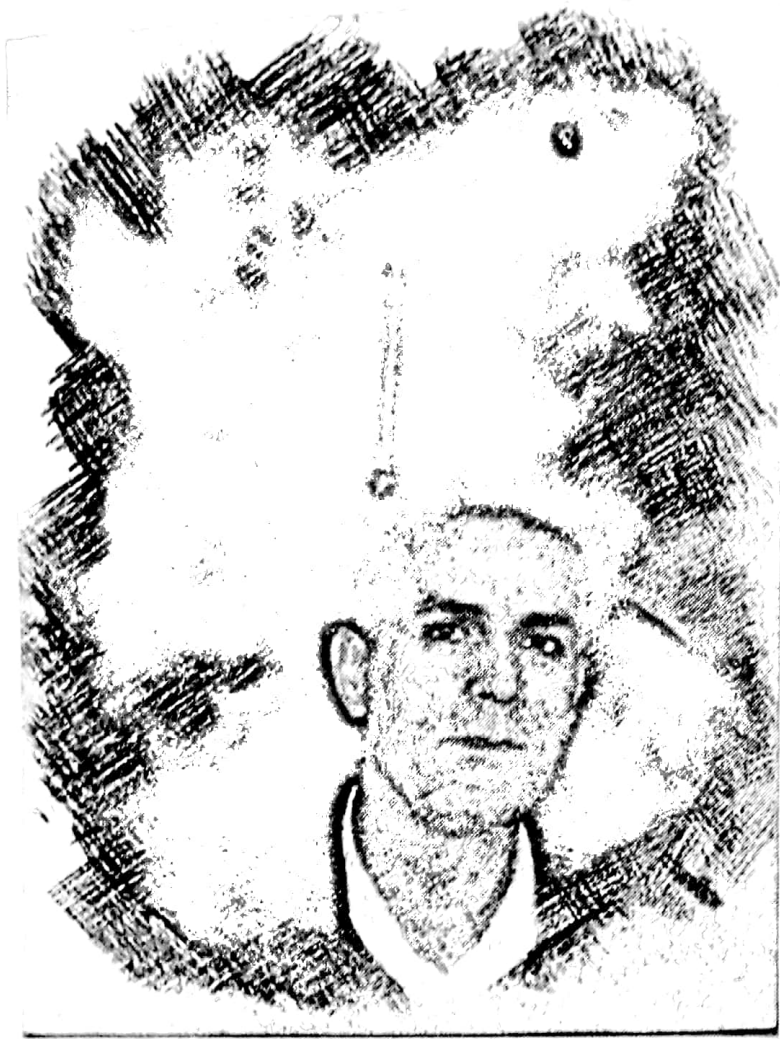
نووسەر و روناكبير

به كر عهلى: « بهرگري » خودا وهك سيسته ميكي نيمون و بهرگري له نيو هوشيارى مروڤدايه .