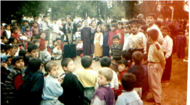
Rewşen Hewlerli çocuklarla