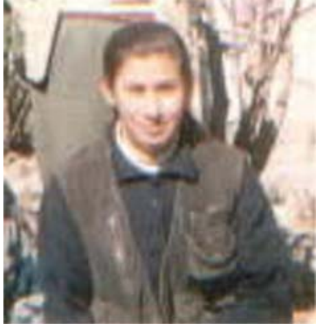
Ronahi (Güneş Geçilmez) 1992 yılından beri PKKli Hewler'de basın bürosunda katledilir.