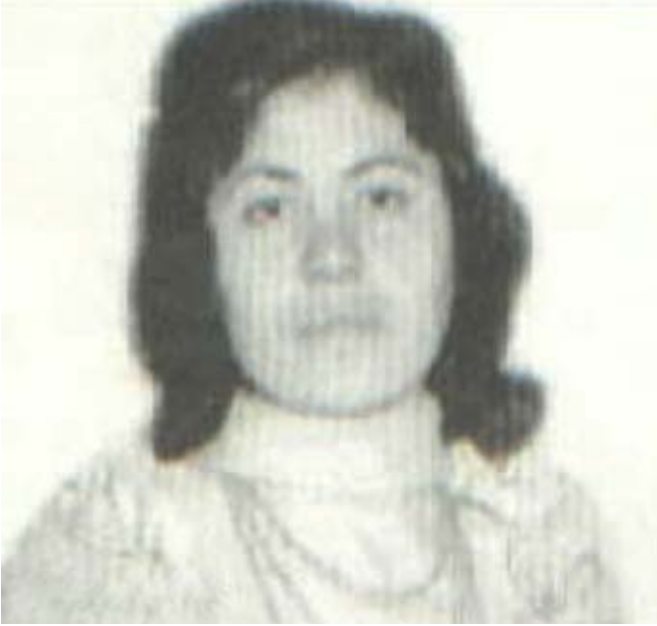
17 mart 1981 tarihinde, Pazarcık yakınlarındaki kırsal bölgede yaşanan çatışmada yaşamını yitiren, PKK'nin ilk kadın şehit ilan ettiği Bese Anuş