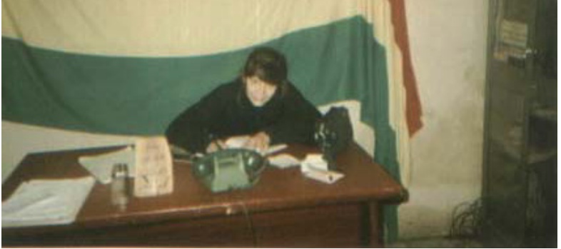
Avyan Hewler'de, YNDK bürosunda