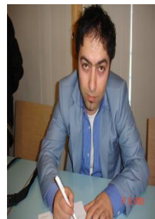
بافل سه ره نگ