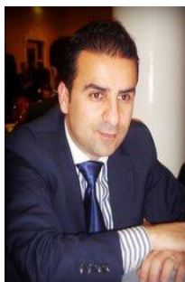
به ختیار به کر