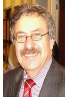
هیوا سه رهنگ