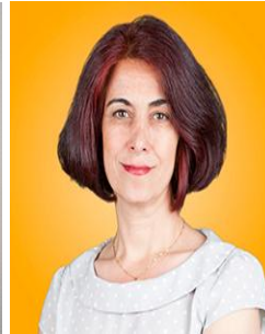
بيريشان جه مال حه مه سه عيد