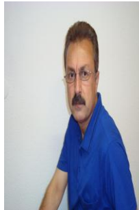
نيساميل ته نيا

دهستپيكر دوو، بابه ته كانيان له م بلاو كراوډيه دا بلاو كړو ته وه. ( 34 ) قه له مي ميښه بابه تيان له " پيوار " دا بلاو كړو ته وه، كه بریتين له ( بيړيقان جه مال حه مه سه عيد ، قيان بيټوشي، ئاقان عه لي مه حمود، داكي پروا، كانياو هه وليري، سه باحت تاهير، دلسوز حه مه، ، شه هين، كه فان شيرزاد هه يني، فينوس فايه ق، ناهيده ره شيديان، كه شبنين به رزنجي، نيگار، ناز نازاد مه ريوان ، شه مام شه وقي، په يمان سه ره ه ننگ، كالي، ره زي تا قانه،