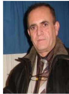
مههمه د جهزا به رزنجی

بلاوکردۆته وه، دواتر دابراون و پایدۆزیان لیکردوه. نووسه ر و رؤژنامه نووسه هه ره چالاک و