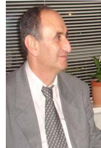
سردار فتاح نه مين

سايه، جوان ناسح بابان، لاقه فه رهاد، روژا حه مه سالح، كه ژال نه حمهد، جوان عومه ر، نارين