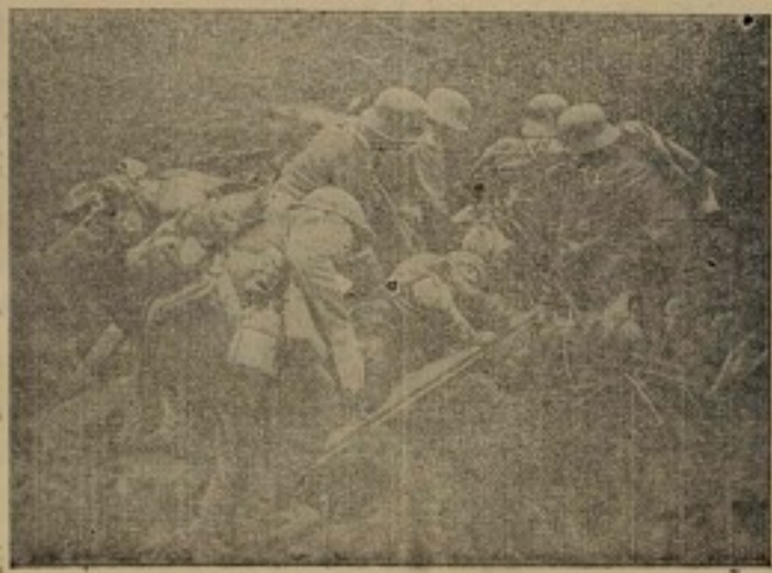
اسیرکان میدان حربا بریندار نقل دکن