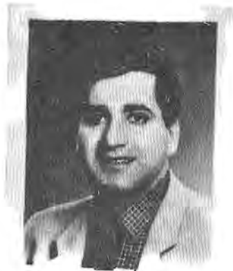
ع . جاف