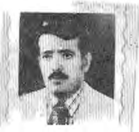
ع . نیرکسہ جاری