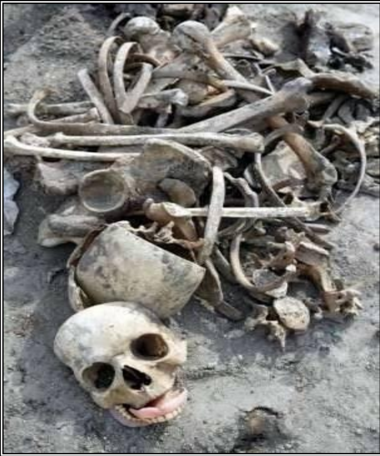
احدى المقابر الجماعية لشهداء الانفال الرابعة