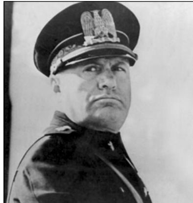
موسۇلىنى Benito Amilcare Andrea Mussolini

موسۇلىنى يەكەمىن كەس دەبى، كە داواى ئەو دەكات، كە ئىتالىا لەگەل ھاوپەيمانەكان بەشدارىي شەر بكا. ھەرۇھا دژى كۆمۇنىستەكان و سەندىكا كرىكارىيەكان دەوھستىتەو. ھەر بۆيە ھەوالگىرى بەرىتانىايى پتوھندىي پتوھ دەكەن. ھەفتانە ۱۰۰ پاوھندى بەپىيى سايتى Wikipedia ئەم ۱۰۰ پاوھندە پارەيەكى زۆر بوو بۇ ئەو كاتە. بەپىيى ئەمىرۆ دەكاتە نىزىكەى ۶۴۰۰ يۆرۆى