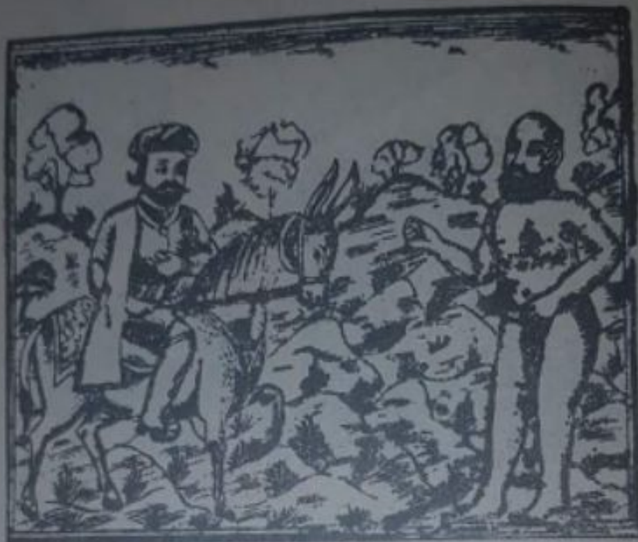
دزەگە قازى رووت کردەو

کراسی منی تیا ناپیئت . ئەمەى گوت و لیباسەکانى قازى لەبەر کردو سوواری کویدر پیژە که بو ئاوزهنگى لیدا هینایە رەقس و سەماو گوتى : ئەى قازى مالى تو حەلالە و چونکە