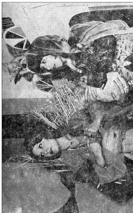
وڻهڻي ديمهڻيڪي شانوگرهه