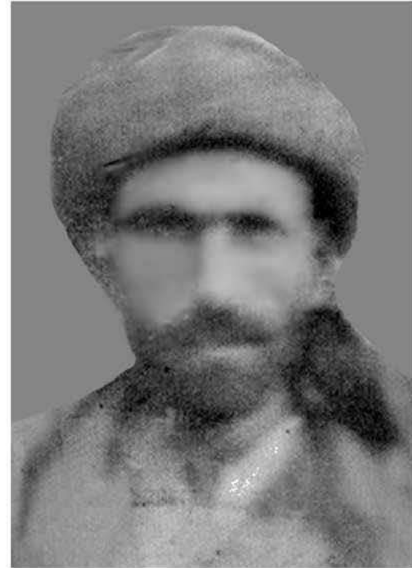
وینە ی لوتفی شاعیر لە سالی ١٩٣٣