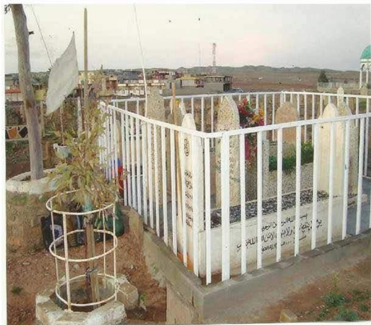
ئارامگای لوتفی شاعیر گۆرستانی ره حیماره / کهرکوک

هەرگیز تێک مه چۆ به بوون و نه بوون هەردووکی دەرۆا له سهەر دونهیای دوون