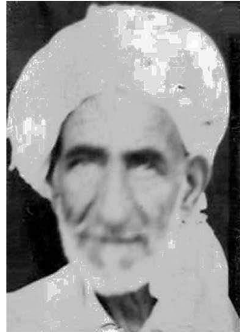
وینهی لوتفی شاعیر له سالی ۱۹۵۸