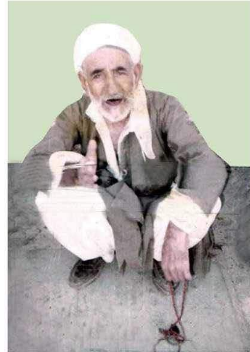
وینه ی لوتفی شاعیر له سالی ۱۹۸۸