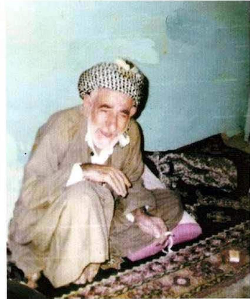
وینە ی لوتفی شاعیر له ۱۹۸۵/۱۱/۱