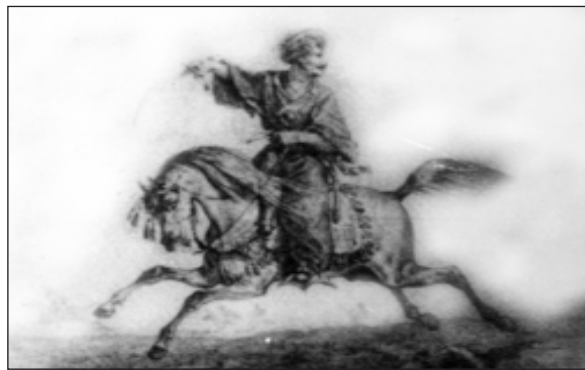
عهبدو لا بهگى جاف و عوسمان بهگى بابان له شهري (گرده گروي) دا