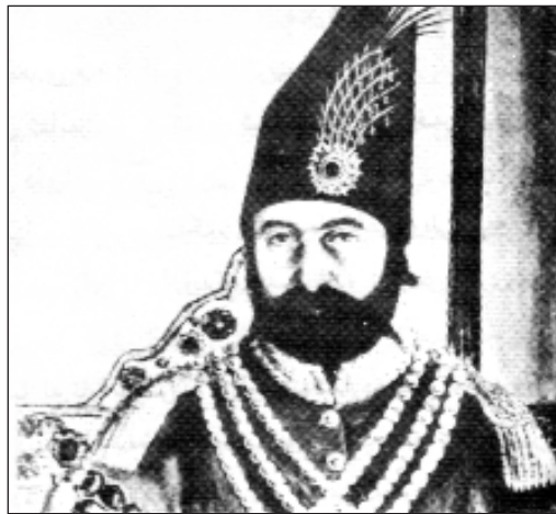
محمد مهّد شای قاجار