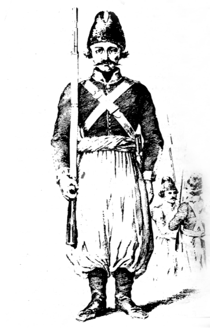
چه‌کداری سویای نیزامی سرده‌می ئه‌حمه‌د پاشای بابان