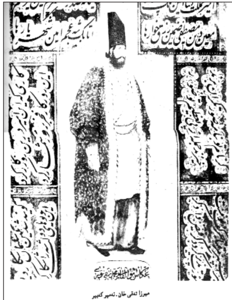
ميرزا تەقى خان - ئەمير كەبىر