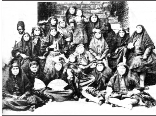
ژنانی حه‌رم سه‌رای ناسره‌دین شای قاجار