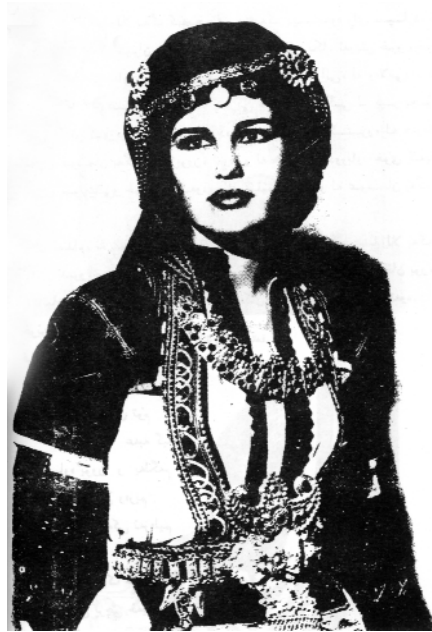
گولنه‌ندام كچى ئه‌وره‌حمان پاشاى بابان، ده‌سگيرانى عه‌بدولا به‌گى جاف