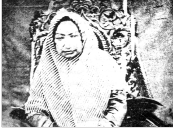
مه‌دولعلیای دایکی ناسره‌دین شای قاجار