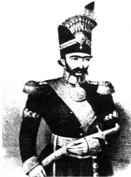
ناسره‌دین شای قاجار

سهرکه‌وتنه‌که به نه‌ندازه‌یه‌ک چاوگیر و گه‌وره و مه‌زن بوو، که‌س نه‌یده‌توانی نازایی و نه‌ترسی له‌شکری بابان نادیته بگری و که‌مته‌رخه‌م تیی بنواری، نه‌و سهرکه‌وتنه‌ ترس و چه‌که‌ره‌یه‌کی فراوانی خسته دلّی دۆست و دوژمنی ده‌سه‌لاتی بابانه‌وه، هه‌مان سهرکه‌وتن بوو به‌هۆی به‌ربلاوی توانا و ده‌سه‌لاتی پاشای بابان و په‌لویوی توانای تا ده‌بوو دوورتر ده‌کوتا.