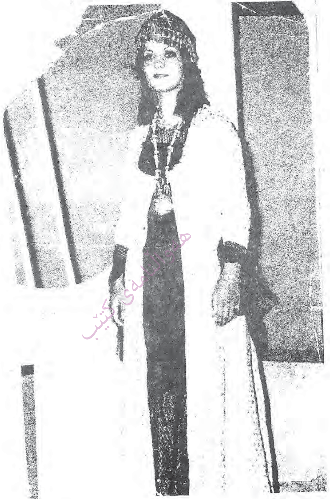
جوانترین پیکر به دریه رسول