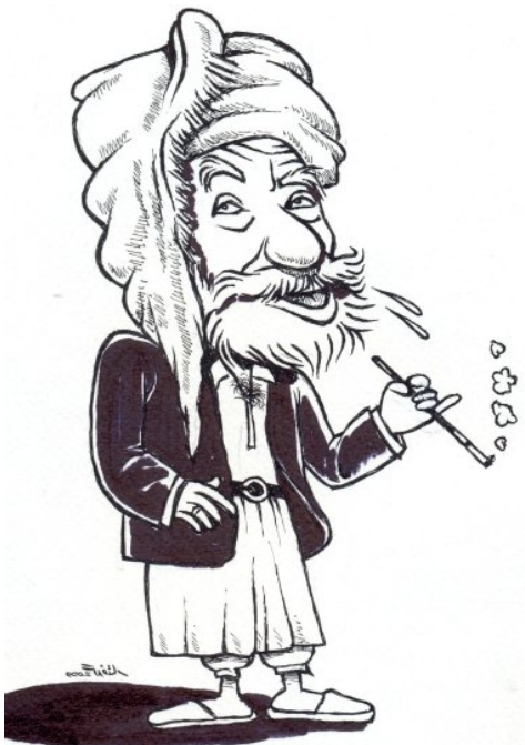
شیخ ره زای تاله بانێ

له بیرم دێ سوله یمانی که دار الملک ی بابان بوو نه مه کوه می عه چه م نه سو فره کیشی ئالی عوسمان بوو له بهر قاپی سه را سه فیان ده به ست شیخ و مه لاو زا هید مه تافی که عه بۆ ئه ربای حاجه ت کردی سه یوان بوو له بهر تابووری عه سه که ر رێ نه بوو بۆ مه جلیسی پاشا سه دای مؤز یقه و نه ققاره تا ئه یوانی که یوان بوو درێج بۆ ئه و زه مانه ئه و ده مه ئه و عه سه ره ئه و رۆژه که مه یدانێ جری دیازی له ده وری کانی ئاسکان بوو به زه ربی هه مله یه به غدا ی ته سفیر کردو تیی هه لدا سوله یمانی زه مان راستت ده وێ باوکی سوله یمان بوو عه ره ب ئینکاری فه زلی ئیوه ناکه م ئه فه زلن ئه م ما سه لاهه دین که دنیای گرت له زومره ی کوردی بابان بوو عومومی شه هر یاران و سه لاتینی فه ره نگستان له روعی سه ته ته تی ئه شپه رده گشتی هه راسان بوو قویری پر له نووری ئالی بابان پر له ره صمه ت بێ که بارانی که فی ئیسانیان وه ک هه وری نیسان بوو که عه بدوللا پاشا له شکر ی والیی سنه ی شپ کرد ره زا ئه و وه قته عومری پینج و شه ش طفلی ده ستان بوو (47)