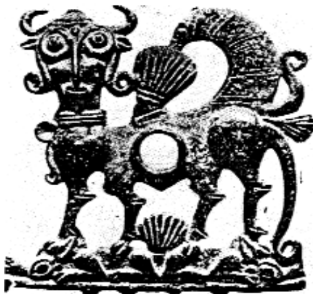
لە خاويكى مسين ھەزار سال پيش زايين

كە چال كراوه يان دھفر و گۆزە و كووپە و دەورپە بەردىنى جۇراوجۇر. لە پروى مېژووھە رەنگە ئەو گۆرانە ھى سەردەمى «ئوروك» بى يان سەرەتاي سەردەمى «برونزى لورستان». دوا كۆمەل و دەستەي كەلەپوورناسان كە چوونەتە ئەوى ئەشكەوتەكانيان ھەلكەندووه و پشكنىپە لە سەردەمى «پەھلەوى» دا بووه بە سەرۇكايەتپى پرؤفيسۆر ماك بورنىي مامۆستاي زانكۆي كەمبىرىج بووه كە لەو گەشتەدا زۆر لە وینە ھەلكەنراوھكانى سەر تاشەبەردى ساغ كردووھتەوھ و بەوردى نیشانەي سەردەمى «پالئولتيك و نئولتيك» ى دۆزىوھتەوھ.