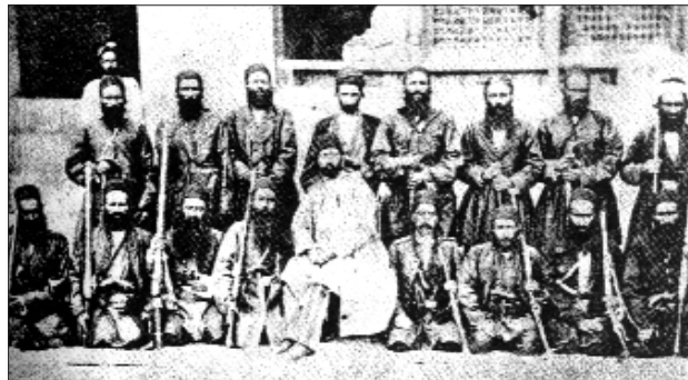
مظفر الملك فەرمانرەوای لورستان لەگەل سەرۆکەکانى عەشایەرى حسنەوھندا لە سالى ۱۸۹۰ز

شاھوێردى خان زانى توانای بەر بەرەکانى سوپای قزلباشى تیدا نىيە، لە خورەم ئاباد رۆيشتە دەرەوھ بەرەو ناوچەى سیمرە. سوپای قزلباش گەيشتە لورستان و يەكێک لە فەرماندەکانى شاھوێردى خان بە خۆى و دوو ھەزار