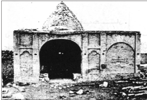
گومه تی ابو الوفا

(فضل الله) له سالی هه وتسه د و چلی کۆچه ریدا له دایک بووه و به کهوا دوورین ده ژیا، له پرووی ره وشت و هه لسان و کاروبار و رهفتاره وه به باشی ناوبرابوو و ناسراوه به (فضل الله) ی هه لآخوور، له سالی هه وتسه د و هه شتا و هه شتا بیرورای ئاینی خوی ئاشکرا و دهستی به بلاو کردنه وهی کرد و که وته ته قالا. له سالی هه وتسه د و نه وه د و هه شتا که خه ریکی دانانی کتاویک بوو به ناوی