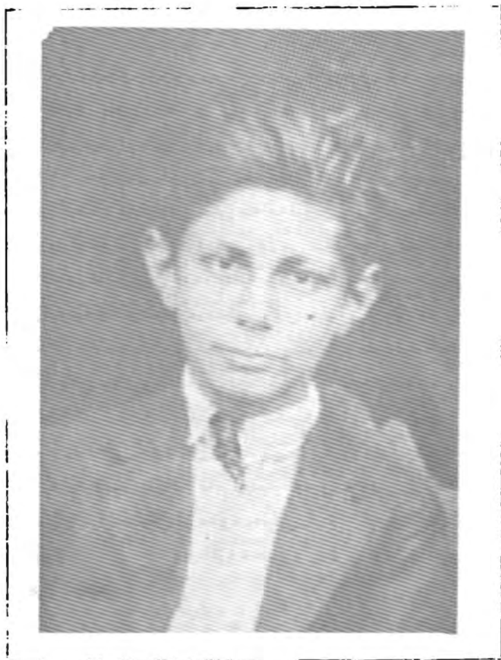
دندار له پوټی سیه م سه ره تاییدا