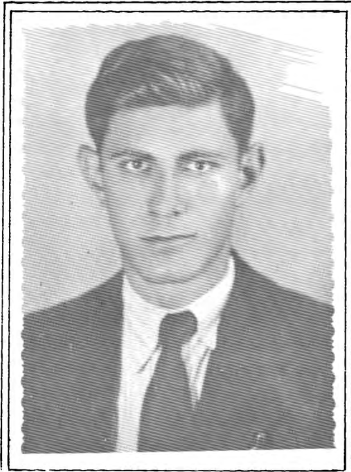
ئەي رەقىب ھەر ماوەفەمى كورد زوبان ناي رەمىنى دائەبى تۆپى زەمان ئىمە رۆلەي رەنگى سوورو شورشىز سەبرىكە خوينايوئە رابوردومان