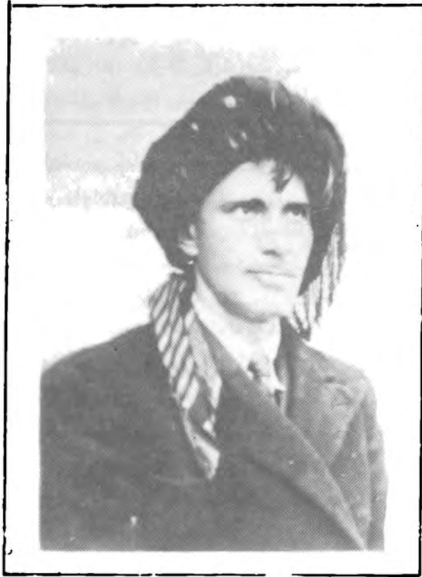
دلدارى پاریزمر شه‌مهش دووا وینه‌یه‌تی له زیندا