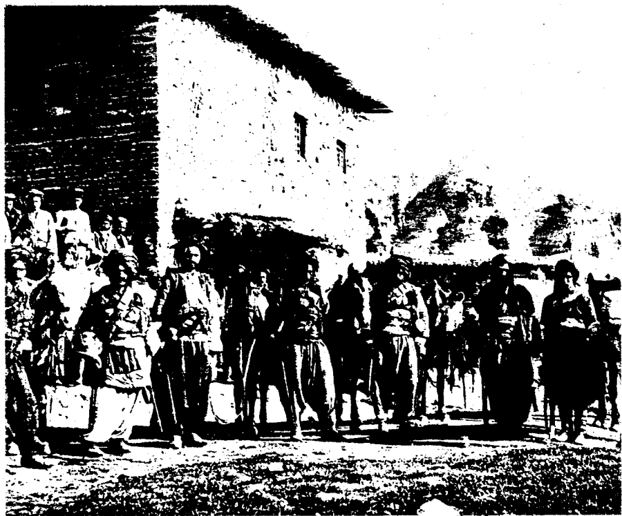
ویندی هندی له عدشایری کورد له ناوچدی رانیه له سالی ۱۹۱۹دا که نهو ویندی په له لایهن مینجر نوئیلهوه گیراوه.