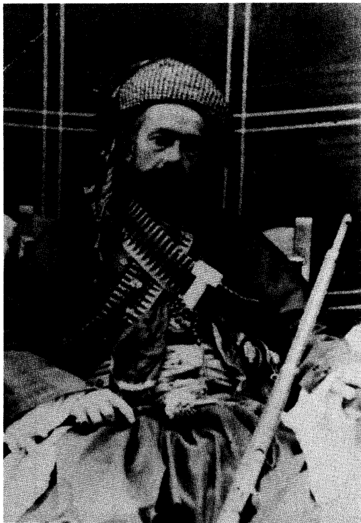
شینخ مەحمودی قارەمان و شۆرشگیر