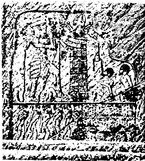
بهرده نووسه‌کمی ئانویانی نی له سهریتکی زه‌هاو لایهره ( ٢٦٢ )