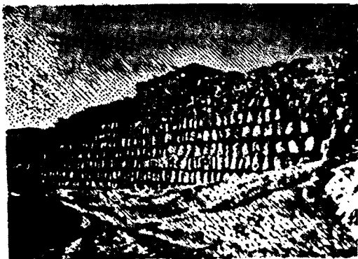
قہلای سمرماژ لایمرہ (۵۹)