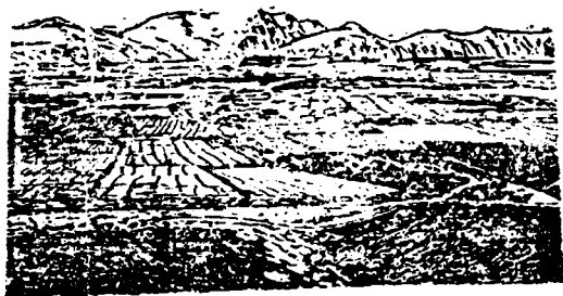
شیوی دینمو ورو نموتہ یولکانہی کونہ شاره کمی لهژیرا شارراوہ تموه