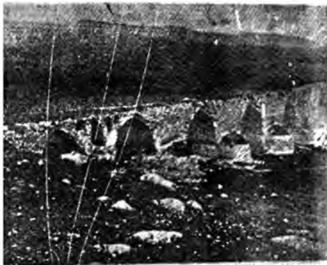
پردی نالیشتہر ( لورستان ) کہ بہ فرمانی بہدردی جہسنوہیہی دوروست کراوہ

« بسم الله الرحمن الرحيم هذا ما أمر ببناءه الامير الاج ابو النجم بدر بن حسنويه ابن الحسين اطال الله بقاءه في سنه تسع وثمانين وثلاث مئة من الهجرة النبويه ٥٠٠٠ » درتزابی ١٨٠٠ ٢١٣ مترو بهر زابی که مہرہ کانی ٢٠ متر بووہ ( کوردو پیوستہ نژادی و تاریخی او لاپہرہ ١٩٥ و کرمانشاہان باستان لاپہرہ ١٨ واکامل ٩/ ٢١٦٢١٣ ) .