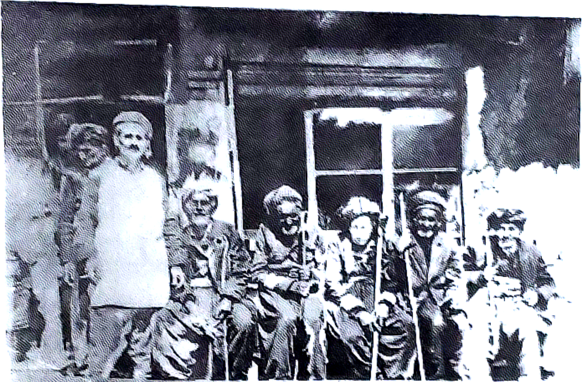
دیمه نی چایخانه ی حه مه مصطفی له پینجوین دیمه نی چایخانه ی حه مه مصطفی له پینجوین