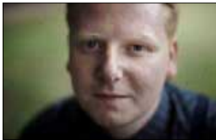
کاله مه گنسۆن

کاتیک کتیبه کان دیجیتالیزه دهبن و به شیوهی جوړه و جوړ لهسه تهختهی خویندنه وهی جیاواز دهخویندرینه وه، کاتیک دانانی بوچوون و هه لسه نگانده کان لهسه کتیبه کان له خویندا دهبنه