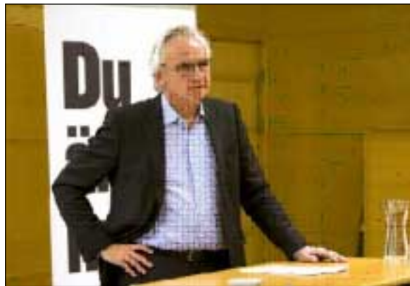
ئىرىك ئۆرىنگ بەرپرسىارى پۆژنامەى فېستېرېوتېن كوريرەن

ئىستا پۆژنامەى فېستېرېوتېن كوريرەن لە خۆيدا ھاوكات بوۋەتە خاۋەنى تەواۋى ئەو خانووبەرەانى كە شەرىكەى گازىت لە شارى ئومىق ھەيەتى. بۆ