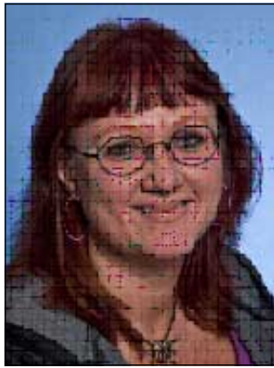
ئينجه لا وادبرينگ

هه مان كفاليتي پيشوو به وهرگر بدرئ. ئينجه لا وادبرينگ پرؤفيسؤر له زانكؤي ناوه پاست له سوندسفال له سويد له م باره وه دهلي: