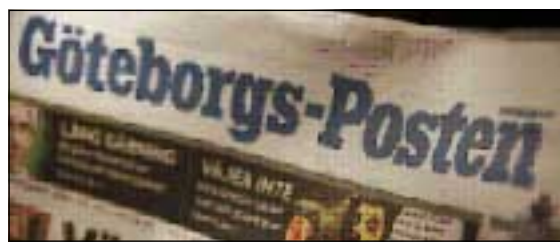
رؤژنامهى یۆتۆبۆرى پۆستین

نرخى ريكلام دینامیکى بهکهه جار له سوید له لای بهکیک له رؤژنامه ههه رهگهوهکانى بهیانیانى سوید، به ناوی یۆتهبۆرى پۆستین ۲ به کردهوه