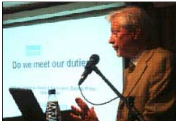
ئولوف كلىبەرى سەرنوسىيارى پيشووى فئىستىربۆتئىن كوريرەن

باشە لە بارودۆخىكى وادا كە گەورهترين رۇژنامەى شارىك دەستى لەگەل شەريكە خانووبەرە و گەوره سەرمايهدارندا تىكەل دەكا و دەبىتە خاوەنى قوتابخانە، زانكۆ و نەخۇشخانە، ئەى كامە رۇژنامە و رۇژنامەفان لەسەر پرس و كيشەى شارەكە بنوسن؟ ئاخۆ لە كاتىكى وادا رۇژنامەكە دەتوانئ رەخنە لە سەرمايهدارىكى وەك يوناس ئولسوون بگرئ كە پىكەوه ئىستا لە قازانج و دۆراندا هاوپىالەن؟ ئەى كامە رۇژنامە چاودىرى بەسەر شىوازى كار و چۆنەتتى كارى پەرودەدا بكا لە كاتىكدا بەشئىك لە پەرودە هەر لە قوتابخانەوه بگرە هەتا زانكۆ ناراستەوخۆ لەلايەن خودى رۇژنامەكەوه بەرپۆه دەچئ؟