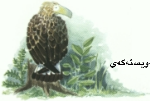
بەلام بە زۆری لەسەر بنەدارە خوشەوئیستەکەى ھەلەنیشت،