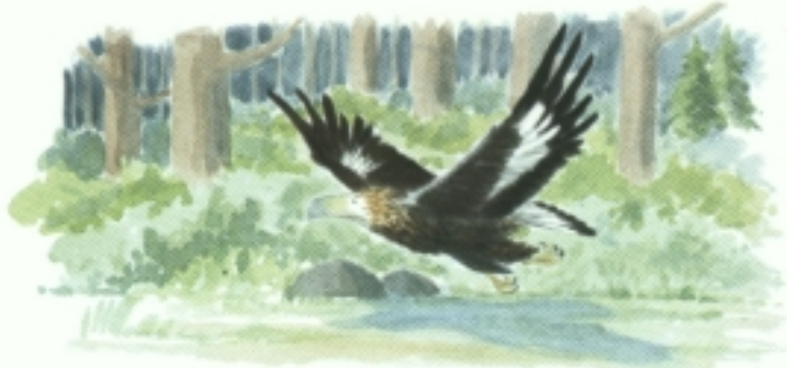
جاریکیان ئەو ھەلقپری و لەسەر دەوھنەکان سووپایەو،