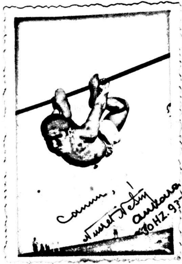
عزیز نهمین سالی 1937 یاریزی ساحه و میدان