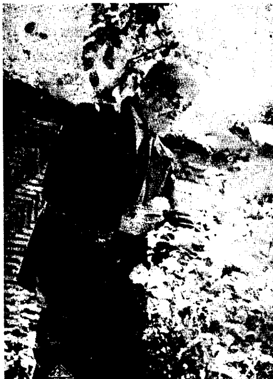
وینه ی پیره میرد له ناو گولانا له وهرزی به هاردا

گوئی (نه سپه کی) و گوئی (دوو پیشکه) گوئی (قه تاره) و گوئی (گوئی مشکه) گوئی (ساق سپی) و گوئی (خه نایی) (گولچینی) و (جه وهه)، (گوله خه تایی) (خه تمی) و گول (ته بهق) دوو شیوه و دوو رهنگ بالا وهك بهیداخ دره خشی روی جهنگ (لاولو) عاشقی نه و بهر نه مامان تیوه ده نائی سهر تا به دامان نه مانه نه پروین له خاکه که مان که چی قه و مه که له پایه ی که مان به هارمان خه زان، پی هه لخرانه بو نه و نه مامان گه لا ریژانه سا خوایه ته نها نیمه ش تو مان هه ی په روه ردگارا که ره مت بو که ی؟