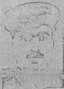
SECRET A "Marsha" in the USSR.