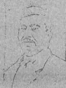
SECRET A later photo.