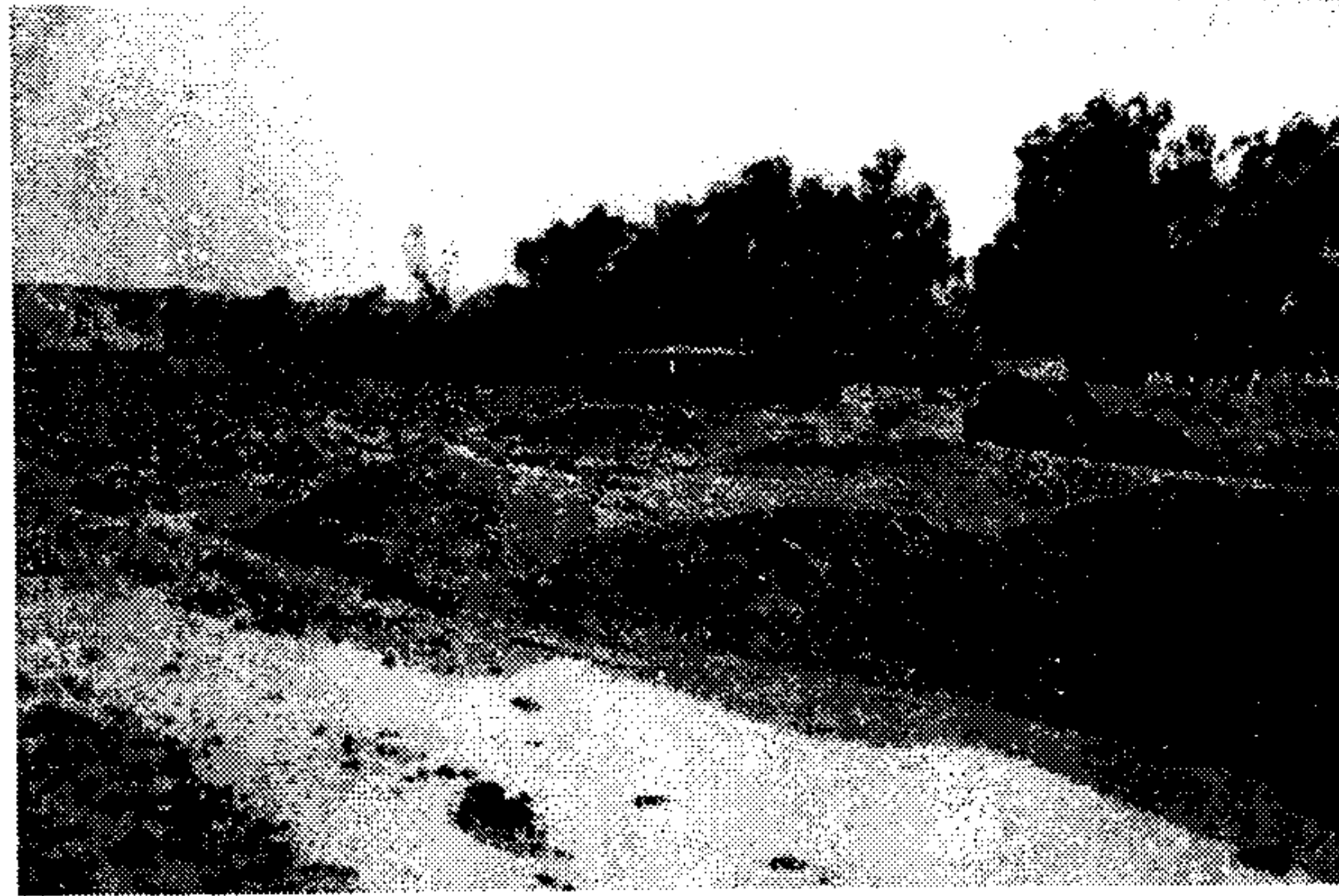
ریگای هاتوچوی پارتیزانه کان دوای ( دووچه کدار روویان کرده دمریبه ند تاله )