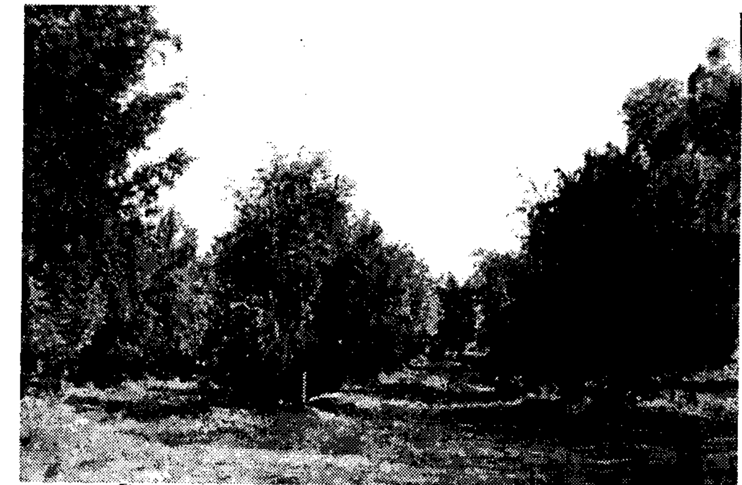
نهو دارانهی کاک کوردوو کاک مه حمود سه نگاوی