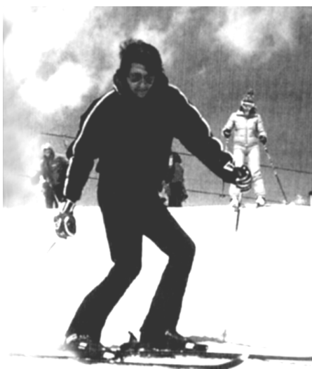
له وینه ی سه ره وه دا سالم له ناوچه ی (سنؤوماس) خلیسکی نه ی سه ر به فر نه نجام ده دات له ناوهر پستی ساله کانی هه شتادا.