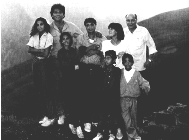
وینهی سه ره وه: ئاههنگی مانگی ههنگوینی، له لای راسته وه جیرالد ئورباخی فرۆکه وانی دیرین وه ستاوه.