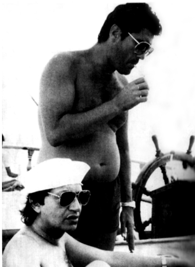
وینه ی سه ره وه: سالم و به چکه فیل له سه ر که شتییه ک.