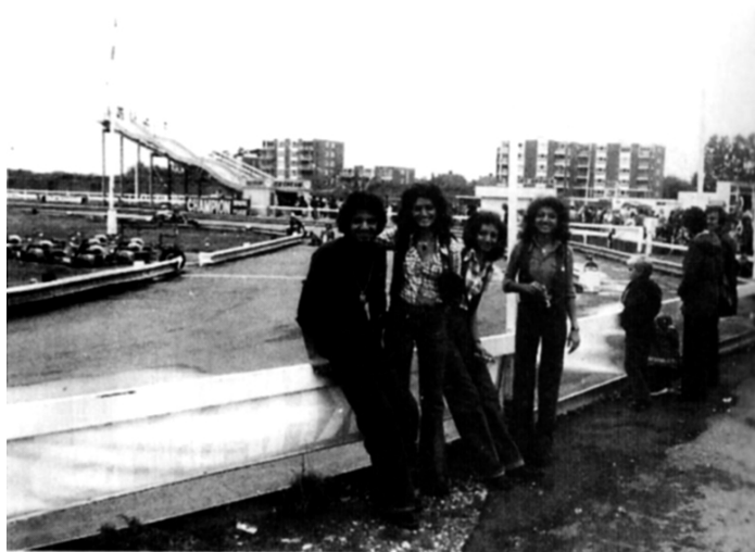
سالی بن لادن و ژماره یه ک له زرخوشکه کانی له پشویه کدا له گوره پانیکی پیشپرکیی (گو کارت) ی ئوتومبیلدا له بهریتانیا له ساله کانی حه فتادا.