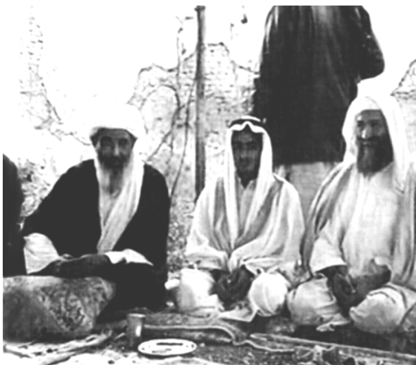
ئەیمەن زه‌واهیری، محهمەدی کورپی ئوسامه بن لادن پیکه‌وه ده‌رکه‌وتوون له ئاهه‌نگی ژنهبینانی محهمەد دا له ئەفگانستان له سه‌ره‌تای ۲۰۰۱دا.