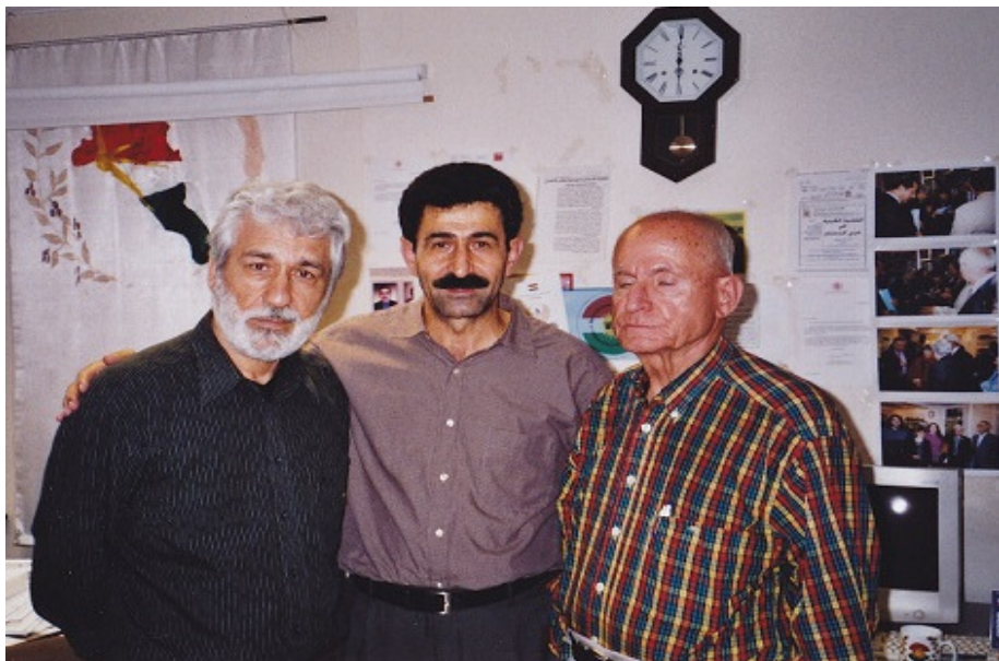
له گه لّ هاو پيران مامؤستا نه به ز و مامؤستا په شينو، له نووسينگه كؤنگره له له ندهن: ريكه وتي: 31/7/2005