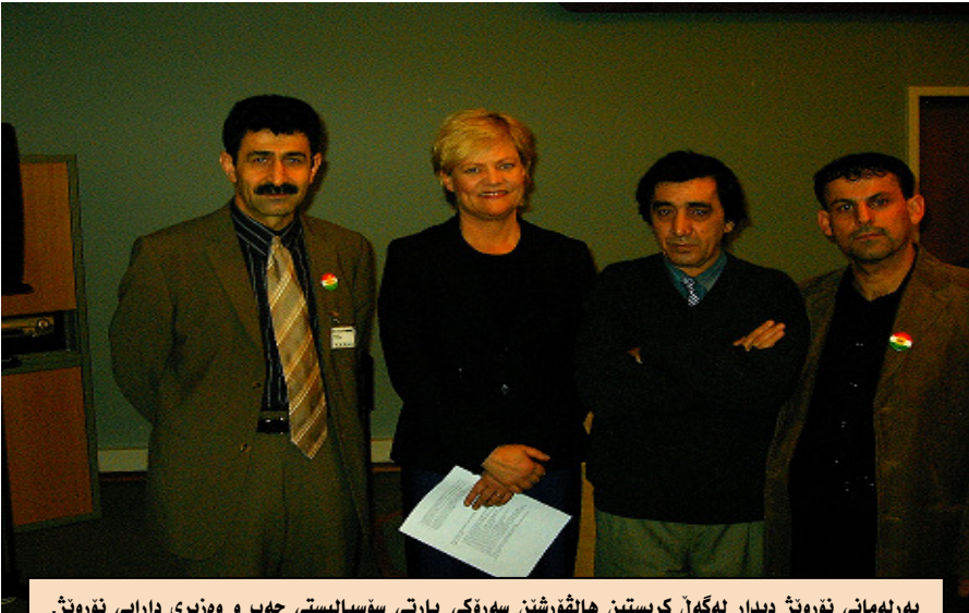
پەرلەمانى نۇروىژ دىدار ئەگەن كرىستىن ھالقۇرشىن سەرۆكى پارتى سۇسالىستى چەپ ۋ ۋەزىرى دارايى نۇروىژ. لەچە پەۋە، سىروان كاۋسى، كرىستىن ھالقۇرشىن، حشمەت شەھىعبان، شۋان بەرزنجى. 18/8/2008