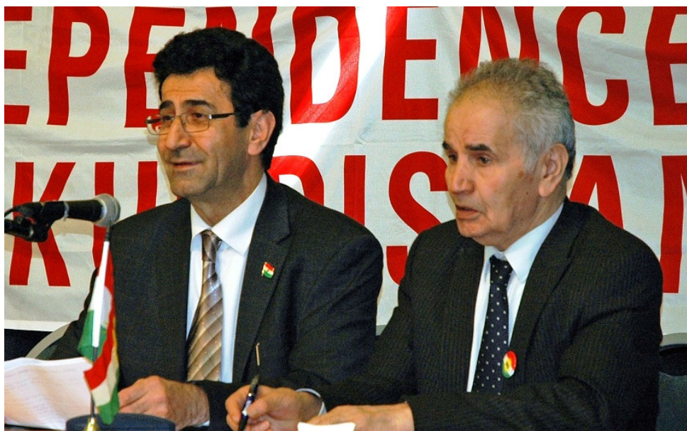
لهگه‌ن شیخ له تیف مه‌ریوانی، کۆنگره‌ی (6) ی کۆنگره‌ی نیشتمانی کوردستان، ریکه‌وتی 18/4/2009