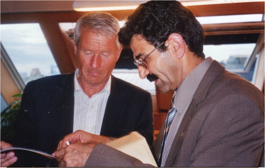
پەرلەمانى نۇروىژ 23 مانگى رەزىبەر (ئۆكتۆبەر) ى 2008 دىدار ئەگەن تۈۋر بىۋېرېن ياگلاند، سەرۆك ۋەزىرانى پىشۋوى نۇروىژ، سەرۆكى ئەۋكاتى پەرلەمان ۋ سەرۆكى ئىستاي كۆمىتەي خەلاتى ناشى ئۆيىل. لەۋىنەكەدا چەند بلاۋكراۋەيەك ئەگەن نامانجەكانى KNC يىشكىشەكەم