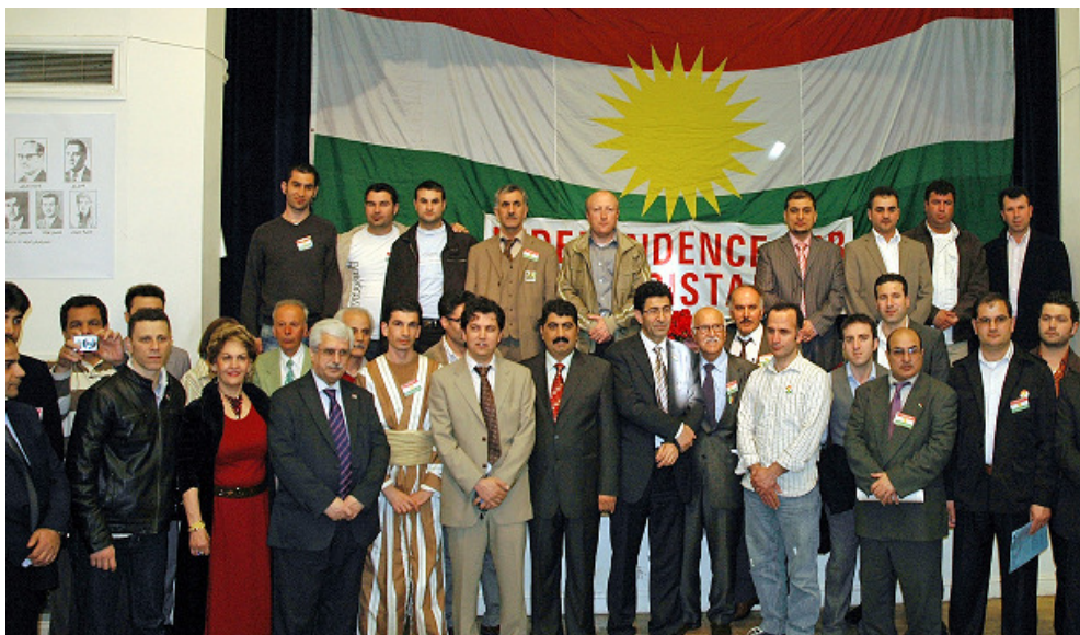
ژمارههك له به شدارانی كۆنگرهی (6) ی كNC له شاری له ندهن، ريكهوتی: 18/4/2009