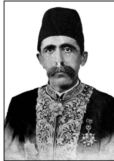
مەحمود پاشای جاف

ئەم شیعەر بەناشکرا دیارە کە شیعری یەکی لە شاعیرانی شیوەی (گۆران - هەورامی) یە و پیرەمێرد وەری گێراوە، بەلام وەک گەلی پارچە شیعری تر کە لەبەر دەستماندا، پیرەمێرد ناوی کەسی لەسەر شیعەرەکە نەنووسیبووە؟! گەلی گەراپن و ماندوو بووین دەقی هەورامییەکەمان نەدۆزیبەو!