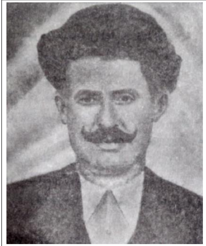
Wêneya Derwêşê Eliyê Yûnis