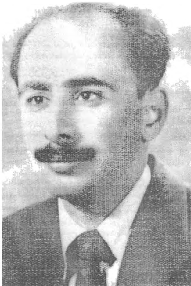
ریتھی (مہرہم محمد نهمین) له تافی لاییدا