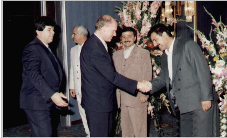
پیشوازی له جیگری سه فیری هۆنه نندا- ۱۹۹۹ / تاران یادی ی. ن. ک