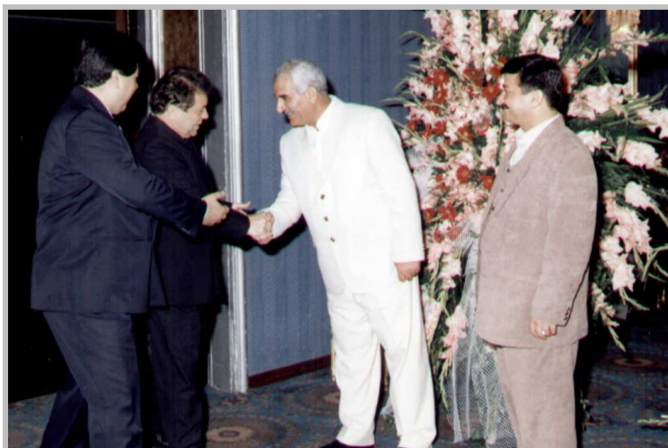
پیشوازی له سه فیری ههنگاریا-۱۹۹۹ / تاران یادی ی.ن.ک