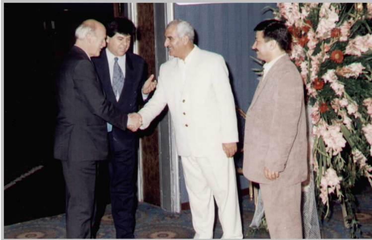
پیشوازی نەسە فېرى نەمسە-۱۹۹۹ / تاران يادى ى. ن. ك