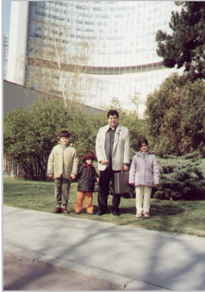
ئەستىرە- بەھرۇز- پىروو- ئاسمان