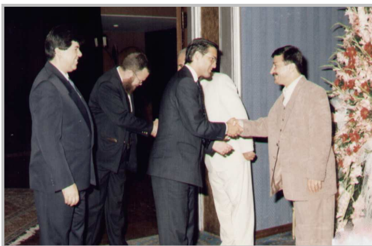
پیشوازی له جیگری سه فیری نیسپانیا-۱۹۹۹ / تاران یادی ی.ن.ک