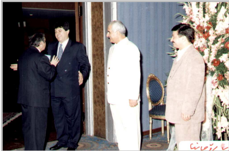
پیشوازی نەسەفیری رۆمانیا-۱۹۹۹/ تاران یادی ی.ن.ک