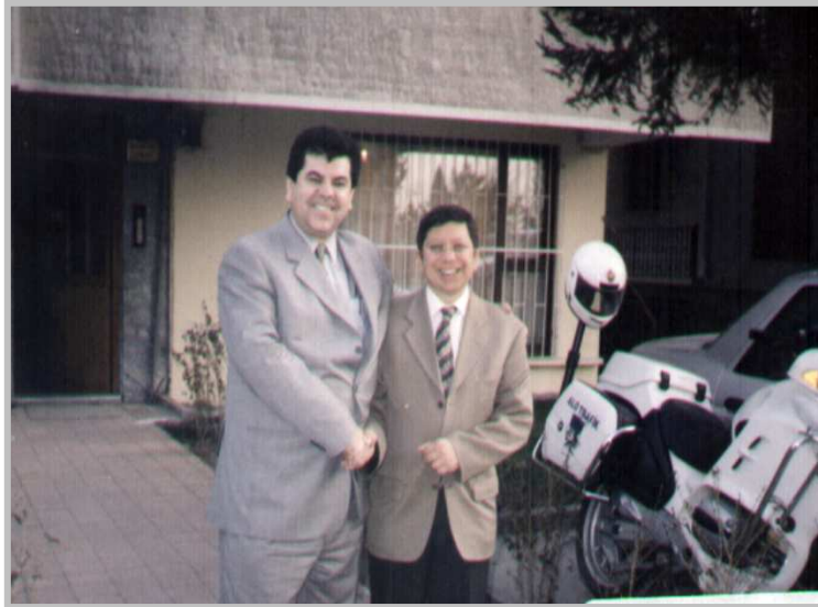
نەگەن نېلىنور چە فېك-۲۰۰۴/۱/۱۵- تورکيا