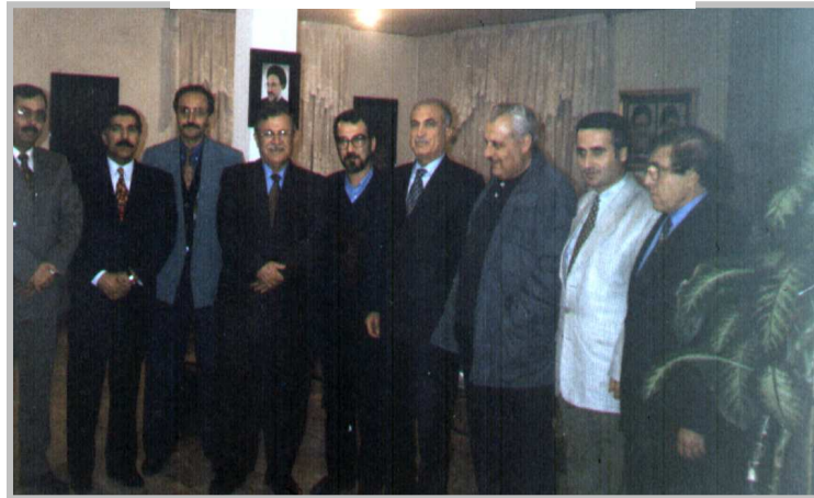
تاران - امام جلال له گهڼ سفیرمکائی عه رب - ۱۹۹۹