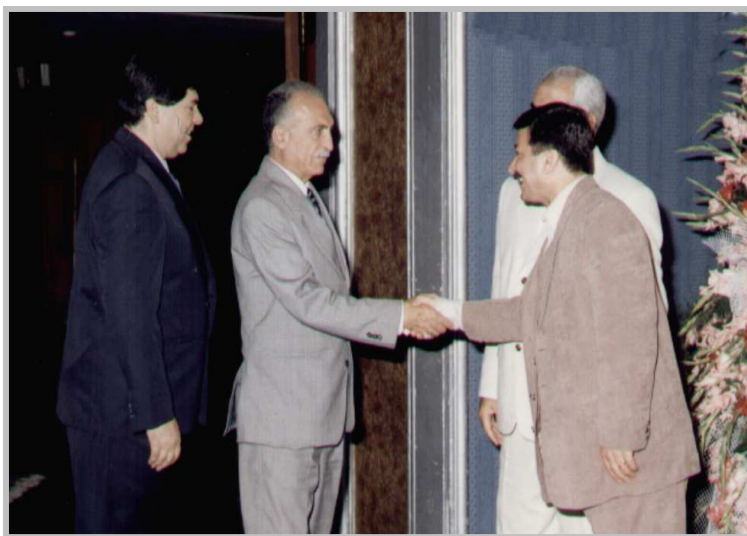
پیشوازی نەسەفیری سوریا-۱۹۹۹/ تاران یادی ی.ن.ک