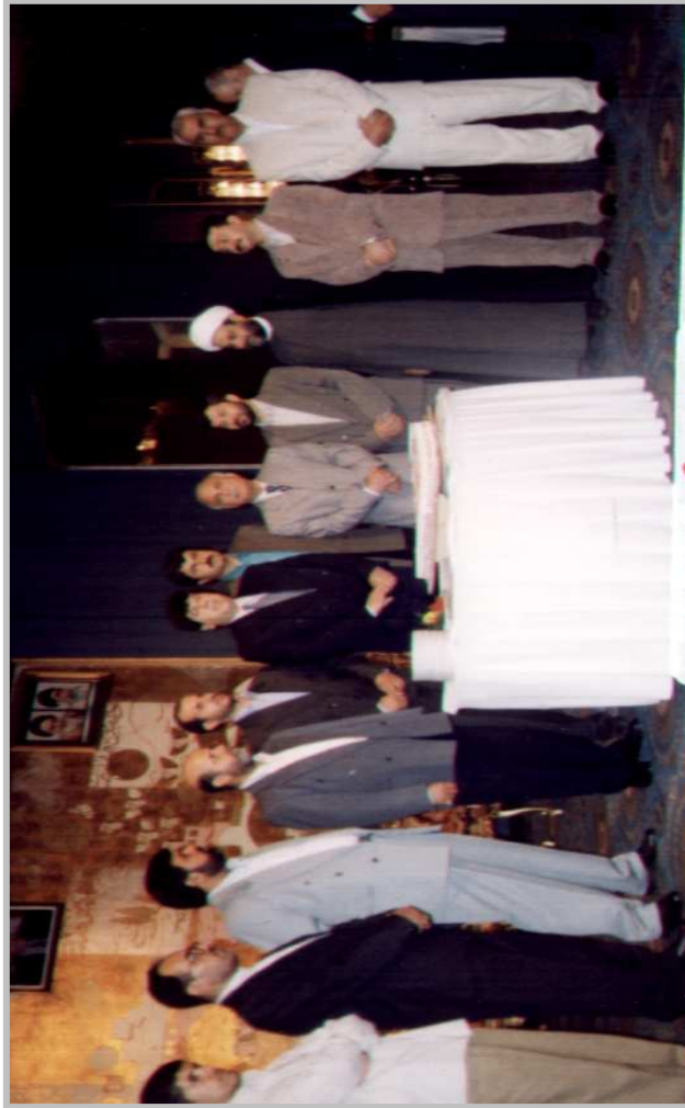
ناھدیگی یادای ن. ن. ک ۱۹۹۹ / تاران